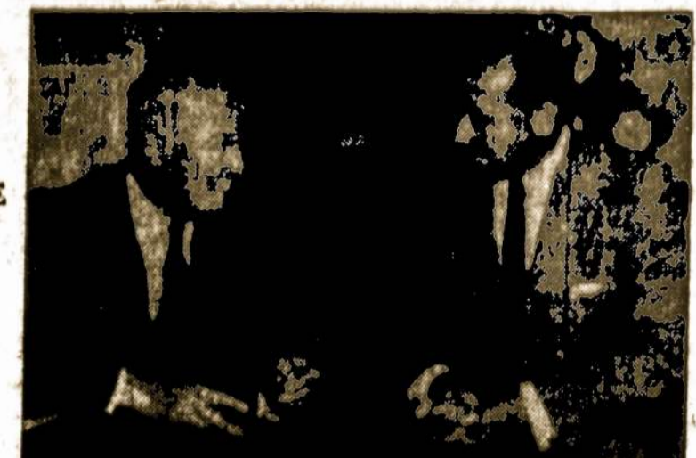
JACOB K. JAVITS, respublikonų kandidatas į Senatą, Baltuosio Rūmose kalbasi su prezidentu D. Eisenhoweriu. Prezidentas pasakė: "Aš noriu ir man reikia Jack Javits tureti Senate."