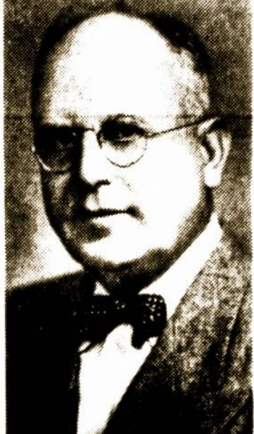
HON. JOHN S. FINE

Lietuviai piliečiai, gegužės 21-mą pirminiuose (primary) balsavimoose paremkit Hon. John S. Fine kandidatūrą Luzerne apskrities Court of Common Pleas teisejo vieton.