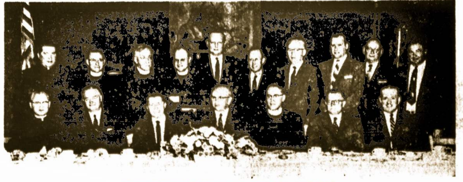
DEDIKACINIO BANKIETO GARBĖS SVEČIAI