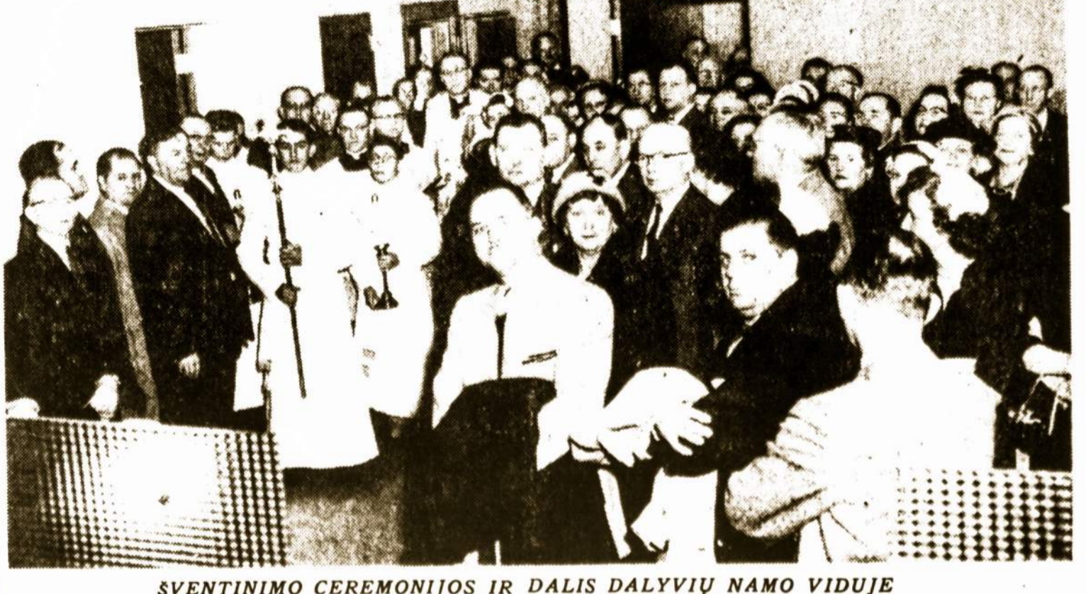
SVENTINIMO CEREMONIJOS IR DALIS DALYVIŲ NAMO VIDUJE