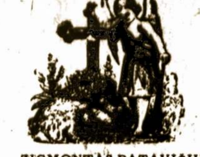
ZIGMONTAS PATAVICIUS, 137 Kuopos narys, gyv. 1517 Roehl St., Rockford, Ill., mirė balandžio 1, 1960.

AGOTA SUKACKYTE, 245 kuopos narė, gyv. 6 College Rd., Schenectady, N. Y., mirė balandžio 6, 1960; palaidota balandžio 8-tą iš šv. Kryžiaus bažnyčios parapijos svetainėje.