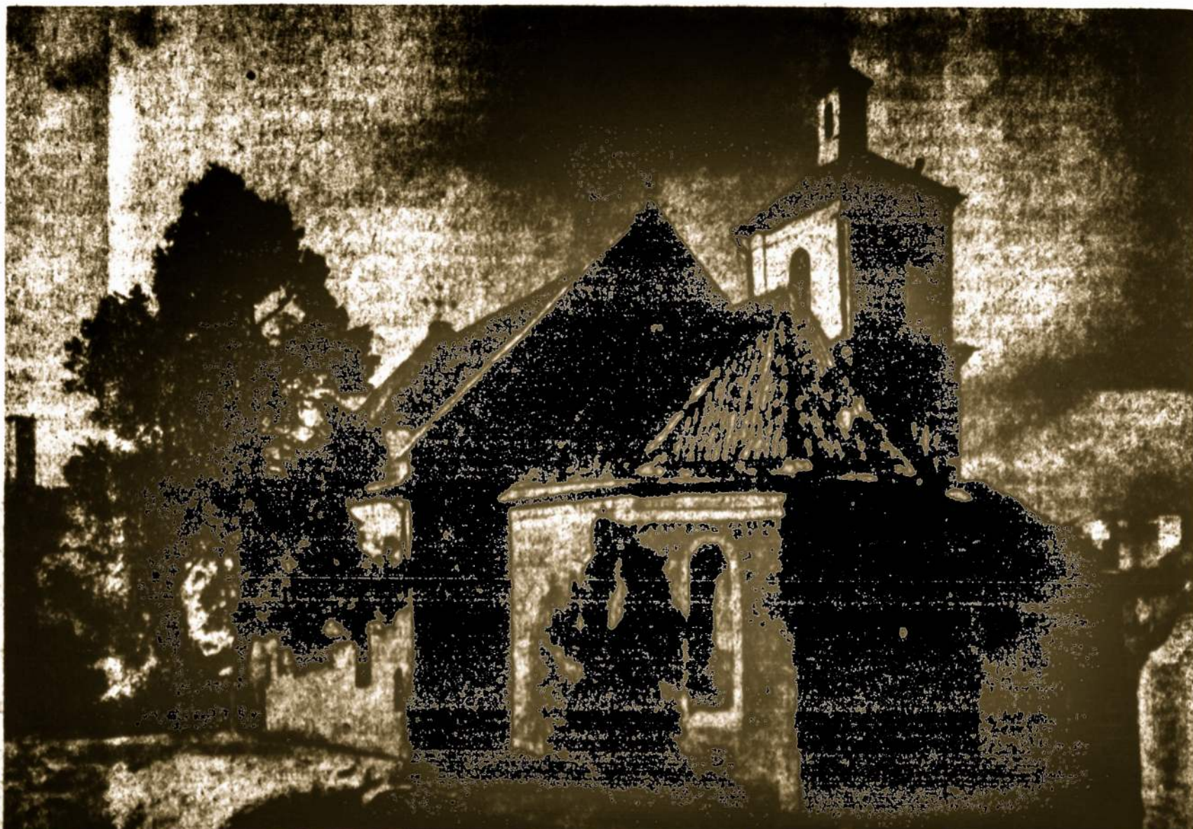
ŠV. MYKALOJAUS BARNYČIA VILNIUJE