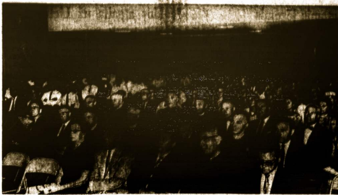
LIEUVIŲ KATALIKŲ MOKSLO AKADEMIJOS suvažiavimo pirmojo posėdžio, įvykusio 1961 m. rugpjūčio 1 d., Chicagoje, dalyviai.