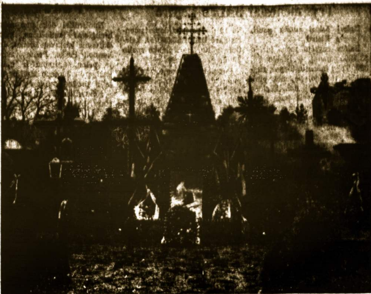
Nepriklausomos Lietuvos įrengta šventovė pagerbti už jo laisvę žuvusius kovotojus, kurią raudonieji okupantai pavertė savotišku šūkišlynu karo muziejum.