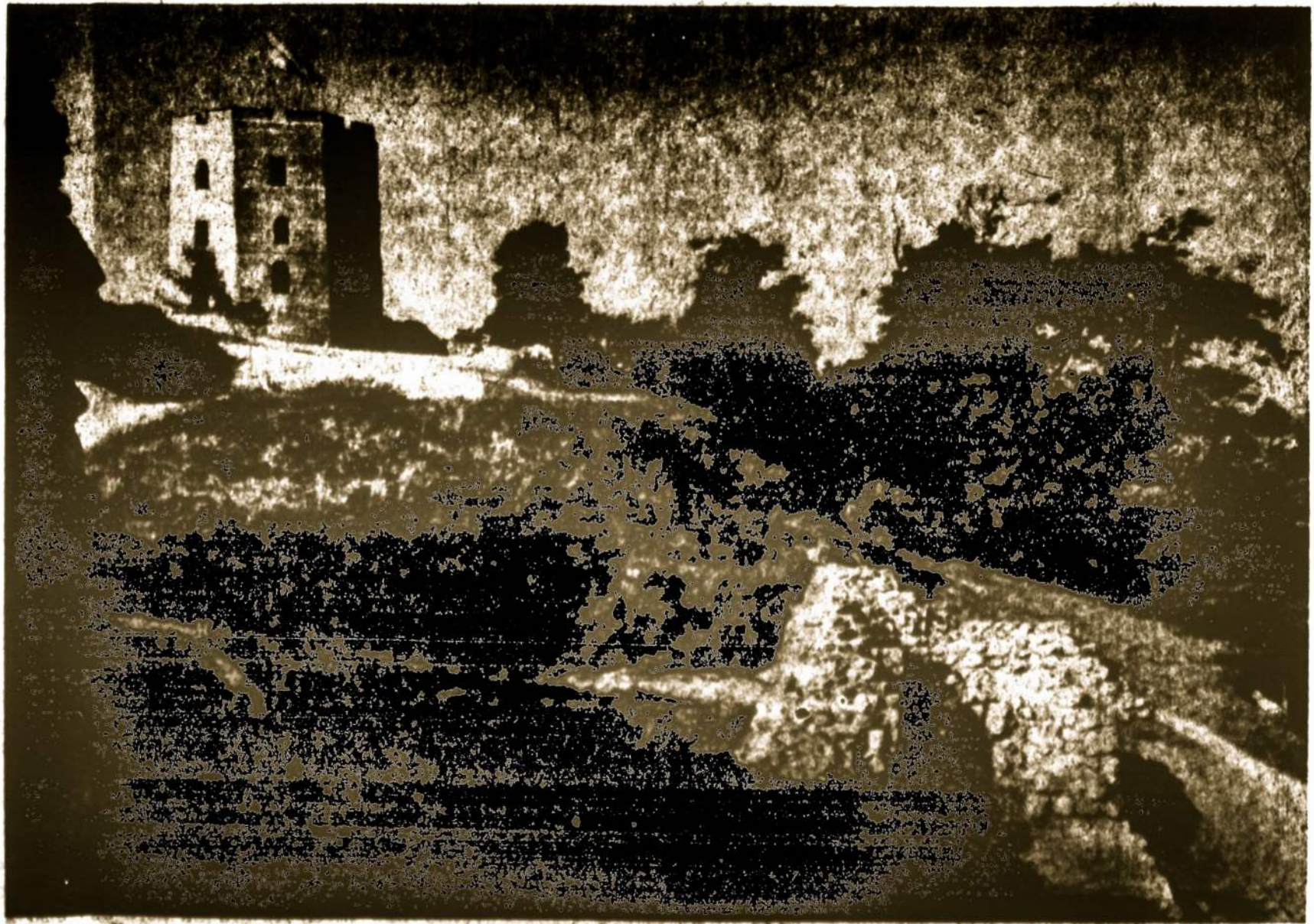
GEDIMINO KALNAS VILNIUJE