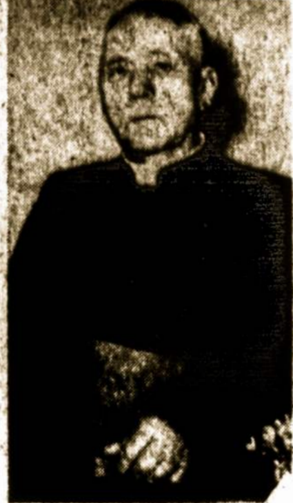
VYSKUPAS T. MATULIONIS

Zinios iš Lietuvos, Kašiadorių vyskupas Teofilis Matulionis ten yra laikomas kardinolu nuo lapkričio 25. Žinia plačiai pasklidusi tuo metu, kai vyskupas Matulionis buvo Kato ligoninėje, kur jis praleido tris savaites. Vyskupas T. Matulionis dabar jau 89 metų, kilęs iš Utenos ap. į kunigus įšventintas 1900 Petrapilyje, vyskupu pašventintas Petrapilyje slapta 1929, Kašiadorių vyskupu ordinu paskirtas 1943. Vyskupas Matulionis buvo ir yra bolševikų kankinys. Jis buvo suimtas ir kalintas trejis metus 1923 - 25. Antru kartą suimtas ir nuteistas 10 metų Solovkų koncentracijos lageruose 1929. Tik Lietuvos vyriausybės buvo iškeistas į Lietuvą suimtus bolševikų agentus 1933. Trečiu kartą suimtas ir išvežtas vėl dešimčiai metų 1946 - 58. Grįžęs iš paskutinio