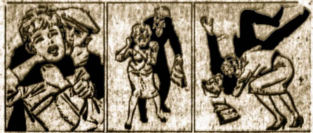
Ja užpuolė boman, bet ji pavartojo seneviškąjį spėjimo būdą — Judo.

"Today we need a nation of Minute Men.... citizens who regard the preservation of freedom as a basic purpose of their daily life...."