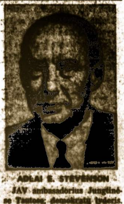
ADLAI E. STEVENSON JAV ambasadorius Jungtinėse Tautose, demokracijos lyderis.