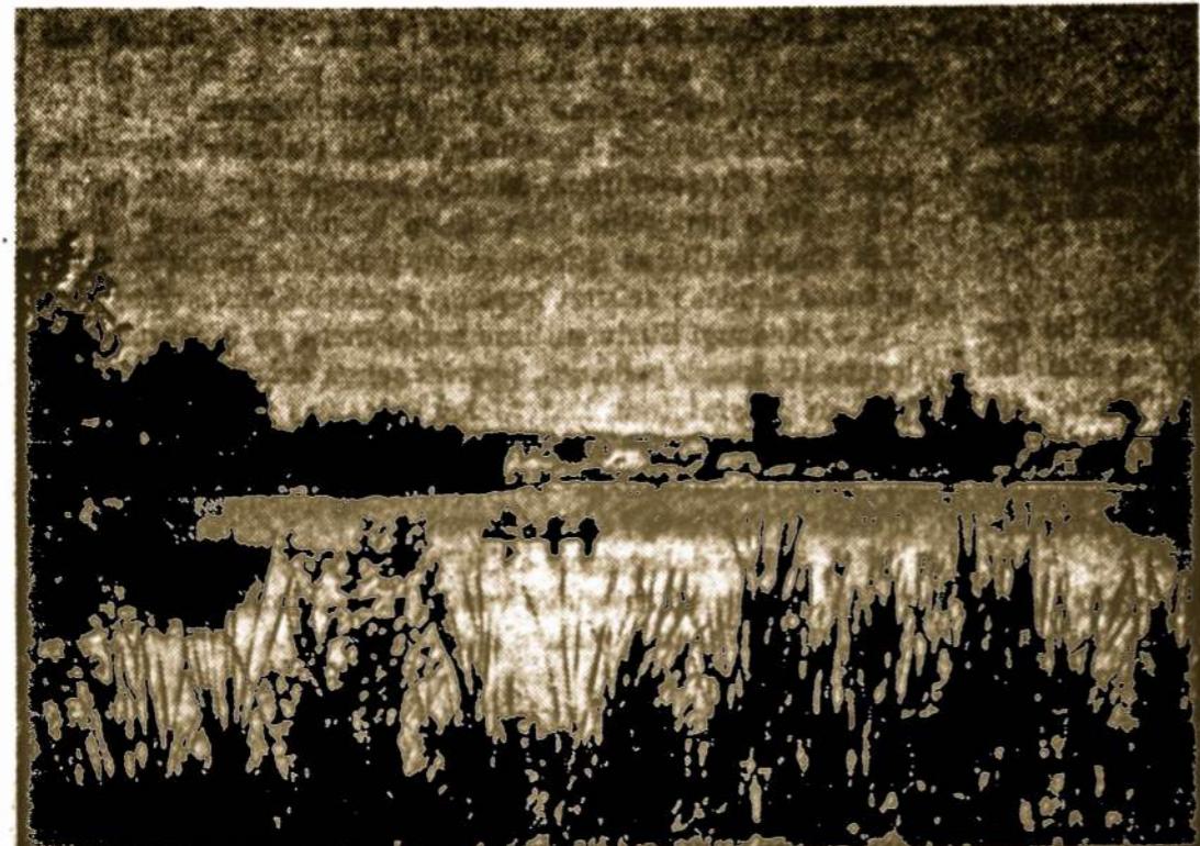
DRUŠKONIS ore pakrantėje Lietuvoje.

The U.S. Government does not pay for this advertising. The Treasury Department thanks The Advertising Council and this newspaper for their patriotic support.