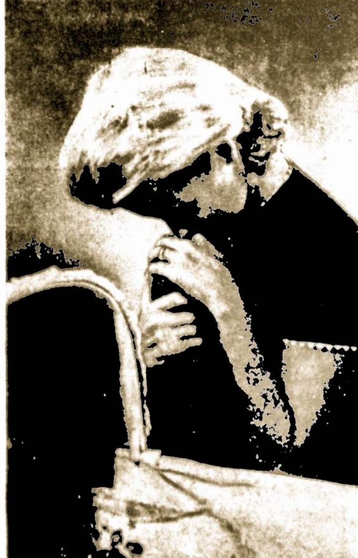
700 times a day a defective child is born to bitter disappointment and a woman's tears.

Teilsis Viešpaties ramybėje! Artimiesiems giliausia užuojauta!