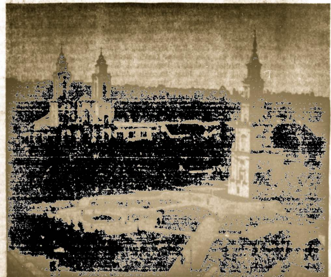
KLAUNO SENAMIESTIS — kairėje Jėzuitų bažnyčia pastatyta 1720; dešinėje — Rotušė pradėta statyti 1542 m., baigta 1562 m.; atnaujinta 1838 ir 1771 m.

Generalinis LRKSA naujų narių vėjus paskelbtas. Į darbą įrašyti naujų narių ir laimėti dovanas!