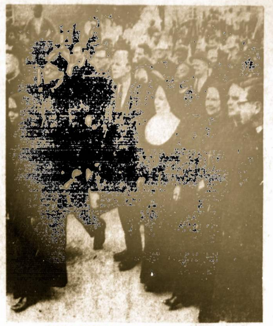
SELMOJE KOVO 10 vienuolės žygio priekyje.