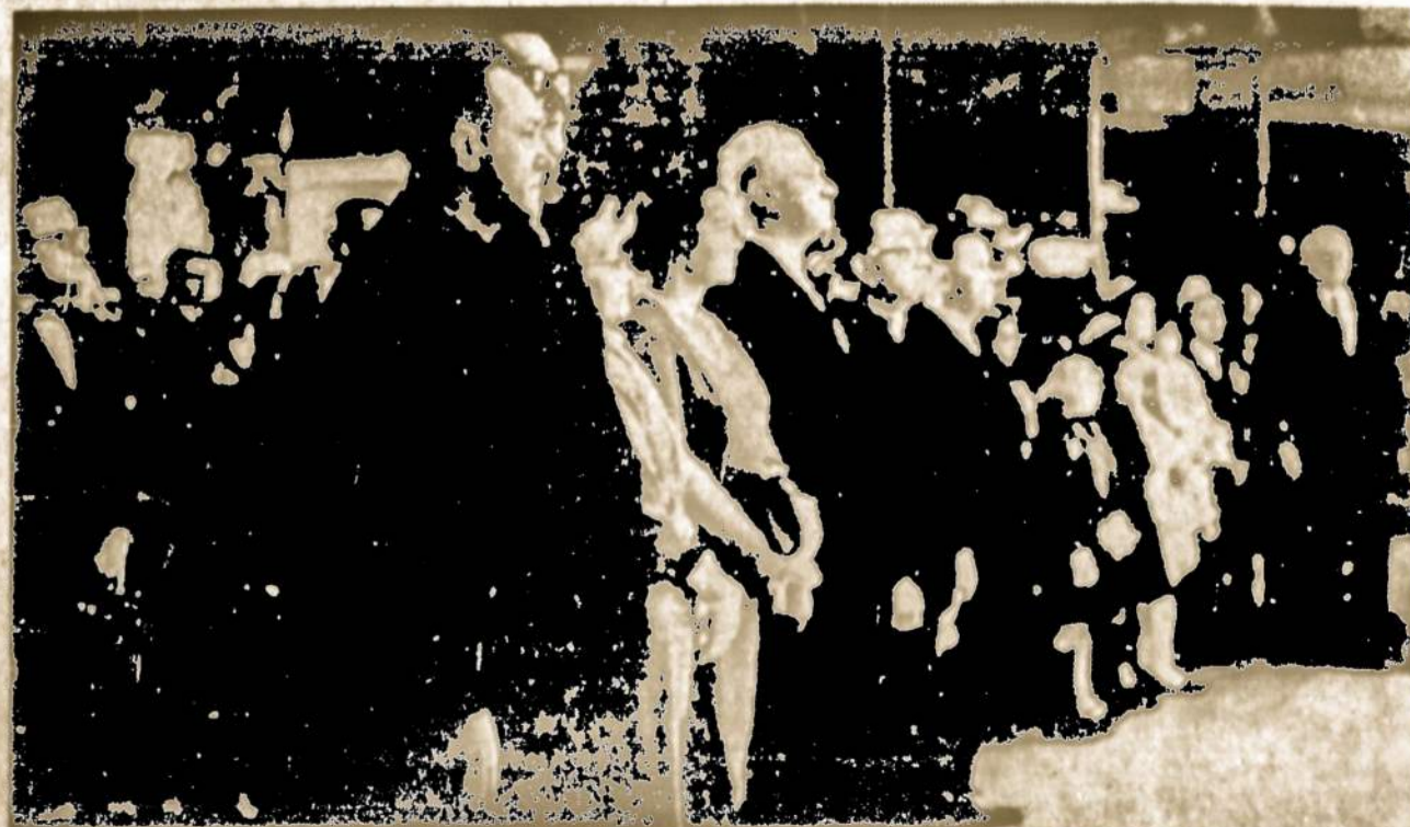
NEPRIKLAUSOMYBĖS MINEJIME NEW YORKE: Nimmio metu.

Kur tavo Vilniau tie spinduliai, Kurios sklėde — Lietuvai mūsų tėvynei? Maironis