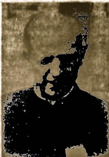
Pedro Arrupe išrinktas Jėzuitų ordino "generaliniu tėvu", Ispanas, Jėzuitų provincininkas Japonijoje; 1965 buvo naujojojo virštininkas 5 mylios nuo Hirošimos, kai į ją buvo numestas pirmas atomas.

Dėja, raudonieji atlikę negirdėtus genocidinius darbus, šiais metais rengiasi iškilmin-