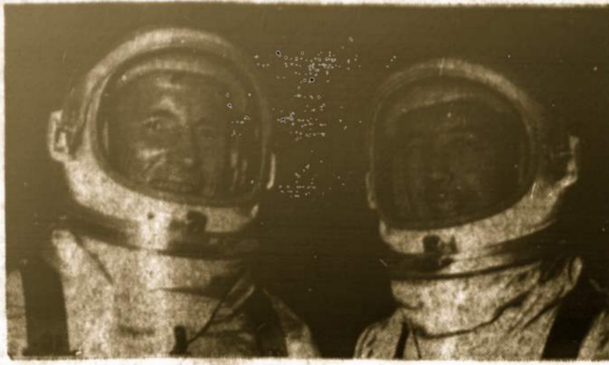
Astronautai White ir McDivitt