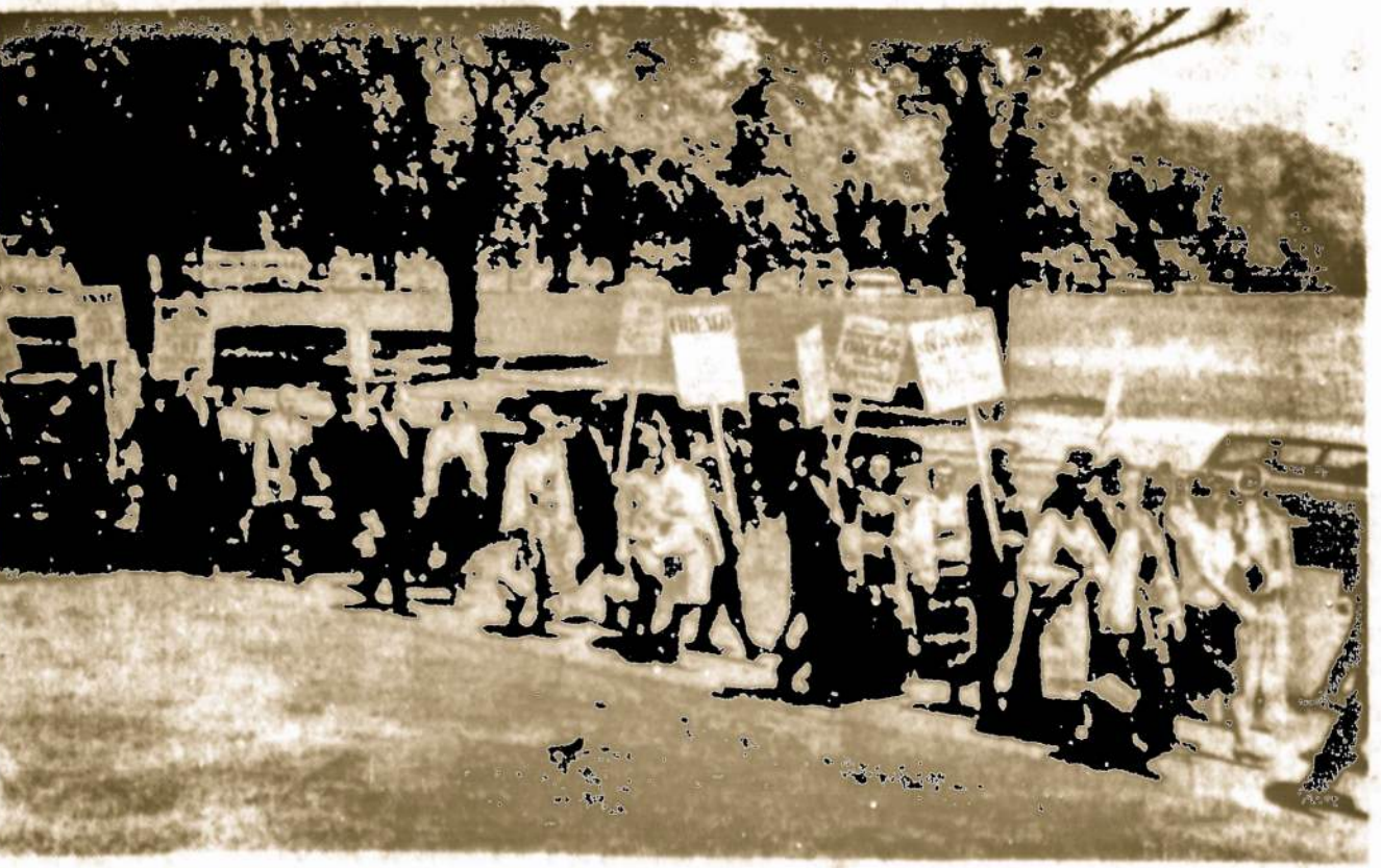
Gegužės 15 lietuvių demonstrantų eiseną prie Lincolnio paminklo, Washington, D.C.