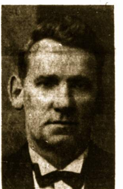
MUZ. JOK. VARAITIS Jungtinio choro dirigentas

š.m. liepos 4. Paliko tėvą ir kitus artimuosius.