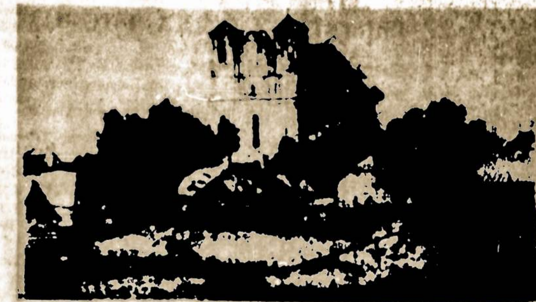
Silvijos bažnyčia prieš šimtą metų