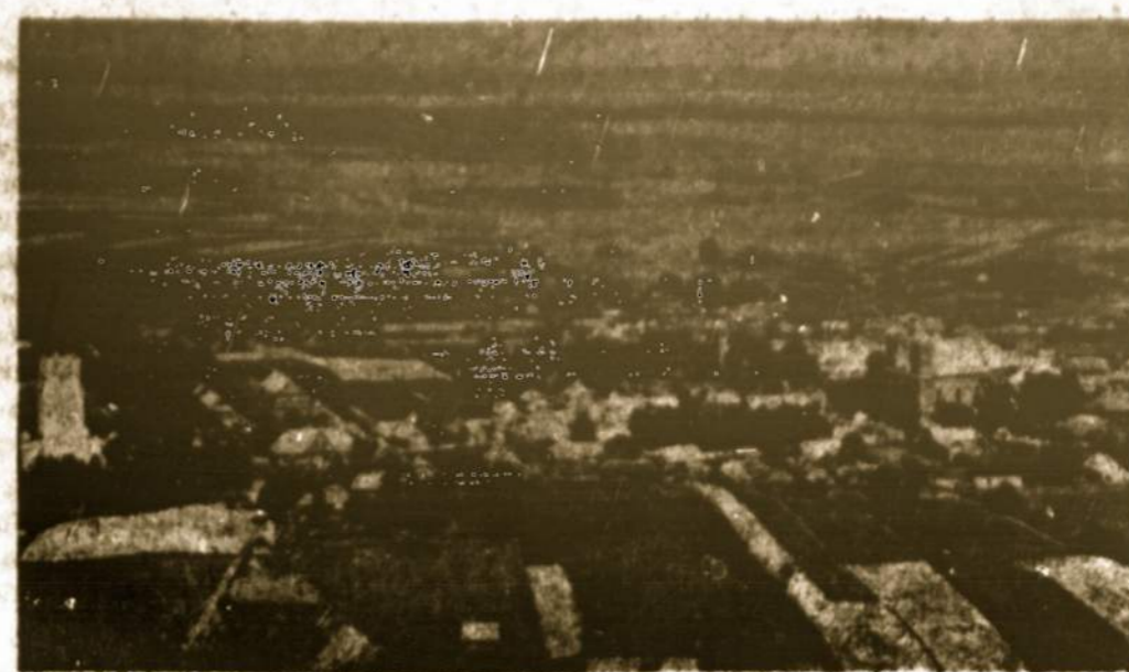
Šiluvos valdas iš oro.

What is meant is this. There is something cheapening for both the boy and the girl in exchanging on the important