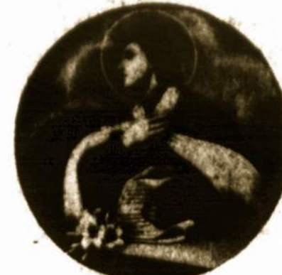
Šv. Kazimieras Lietuvos globėjas

Lietuvos globėjo šv. Kazimiero šventė buvo įsteigta 1636 m. kovo mėn. 4 dieną, jo mirimo dieną, popiežiaus Urbano VIII.