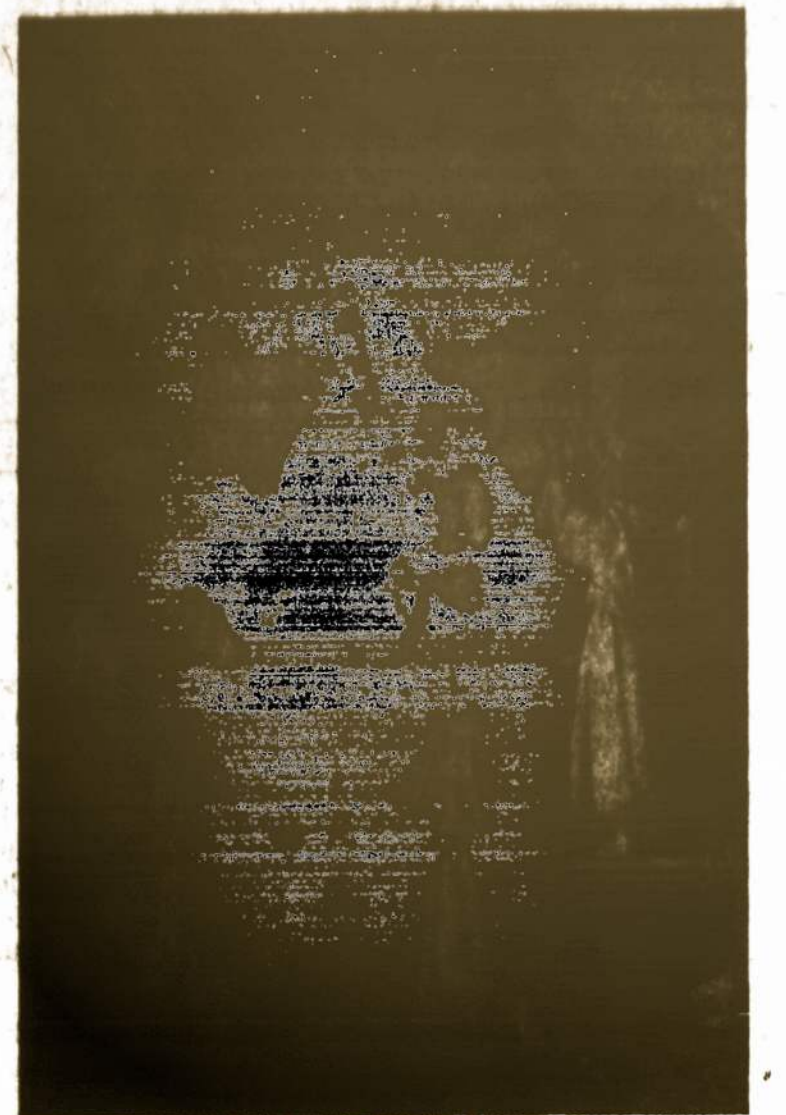
"Šveika Marija, malonė pilnė", — globok mūsų jaunimą

Vyriausias Lietuvos Išlaisvinimo Komitetas praėjusio mėnesio gale kreipėsi į savo atstovybes ir lietuvių bendruomenių vadovybes Pietų Amerikoje, Europoje ir Okeanijoje (t.y. Australijoje, N. Zelandijoje), skatindamas pasistengti, kad jų gyvenamųjų kraštų vyriausybėse, parlamentuose ir spaudoje Lietuva ir jos laisvės byla būtų irgi primenama panašiai, kaip tai esti Jungtinių Amerikos Valstybių vyriausybės sluoksniuose ir ypač Kongrese. Nūrodoma, kad tokias pastangas pagyvinti itin svarbu ryšium su 50 metų sukaktim nuo partarojo nepriklausomos Lietuvos valstybės atkūrimo. (E.)