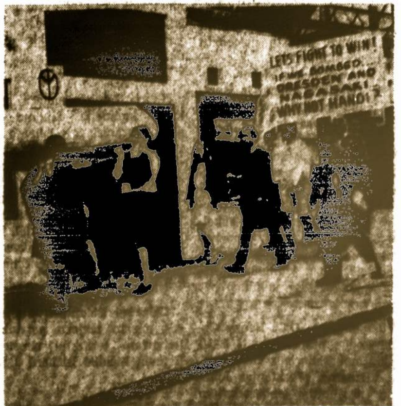
Demonstracijos New London, Conn. Nešamas plakatas, kuriame reikalaujama kariauti iki pergaitės Vietnam.

Hamilton, Kanada. Balandžio 1 Hamiltone įvyko Kanados liet. mokytojų suvažiavimas su aktualiom paskaitom, diskusijom ir vakariene.