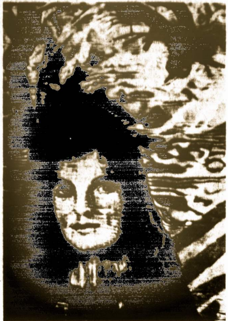
"Tragedy", a portrait of Jacqueline Kennedy

The materials are then removed and he washes the surface clean with soapsuds. This procedure eliminates the danger of a fire from smoldering material in addition to cleaning the painting.