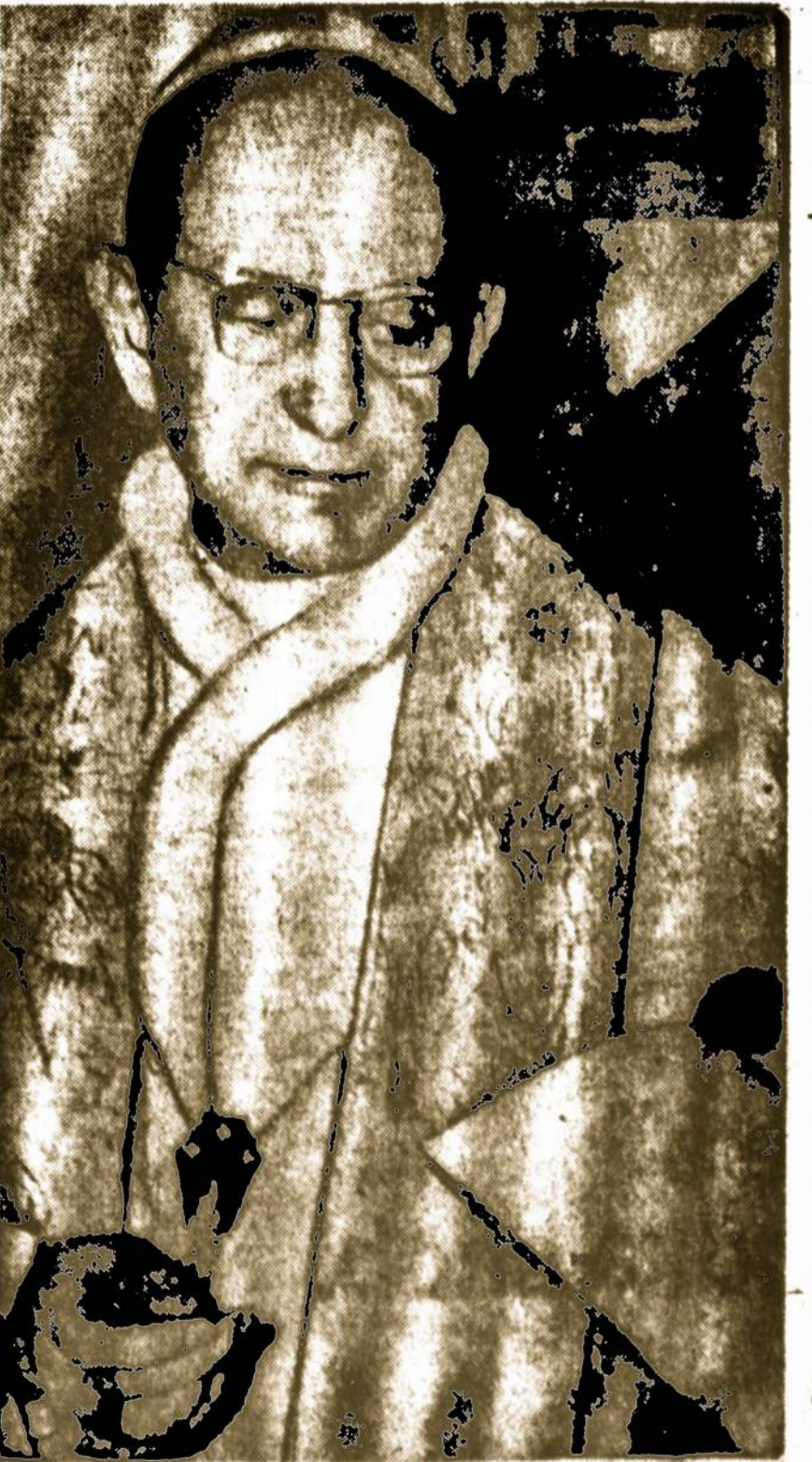
POPIEZIUS PAULIUS VI-sis, š.m. kovo 29 išleido naują socialinę encikliką "Populorum Progressio" — Tautų pažanga.