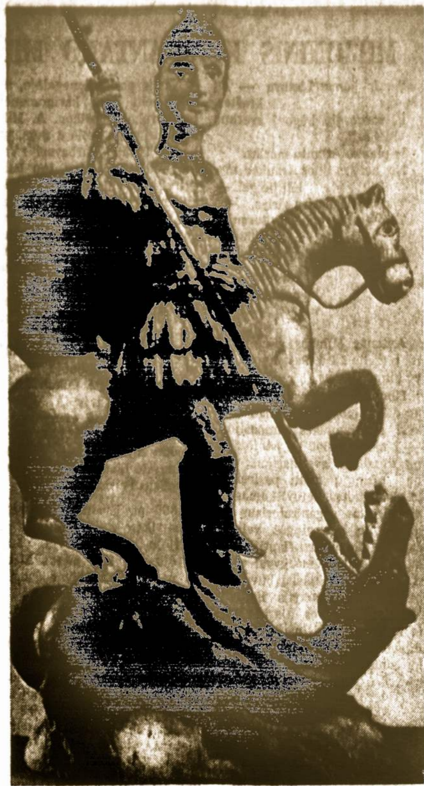
Šv. Jurgis, lietuvių liaudies skulptūra