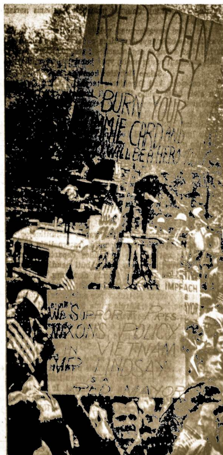
Vaidalai iš gegužės 20 demonstracijų, kurios buvo surengtos "tyliose daugumos" ir nukreiptos prieš New Yorko burmistrą Lindsey, prieš triukšmaujančius studentus.