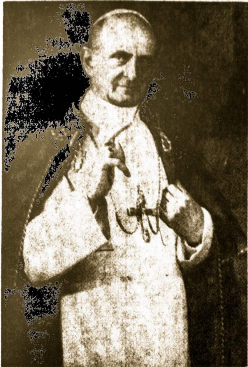
POPIEZIUS PAULIUS VI-SIS 8.m. gegužio 29 minėję 50 metų kunigybės sukaktį