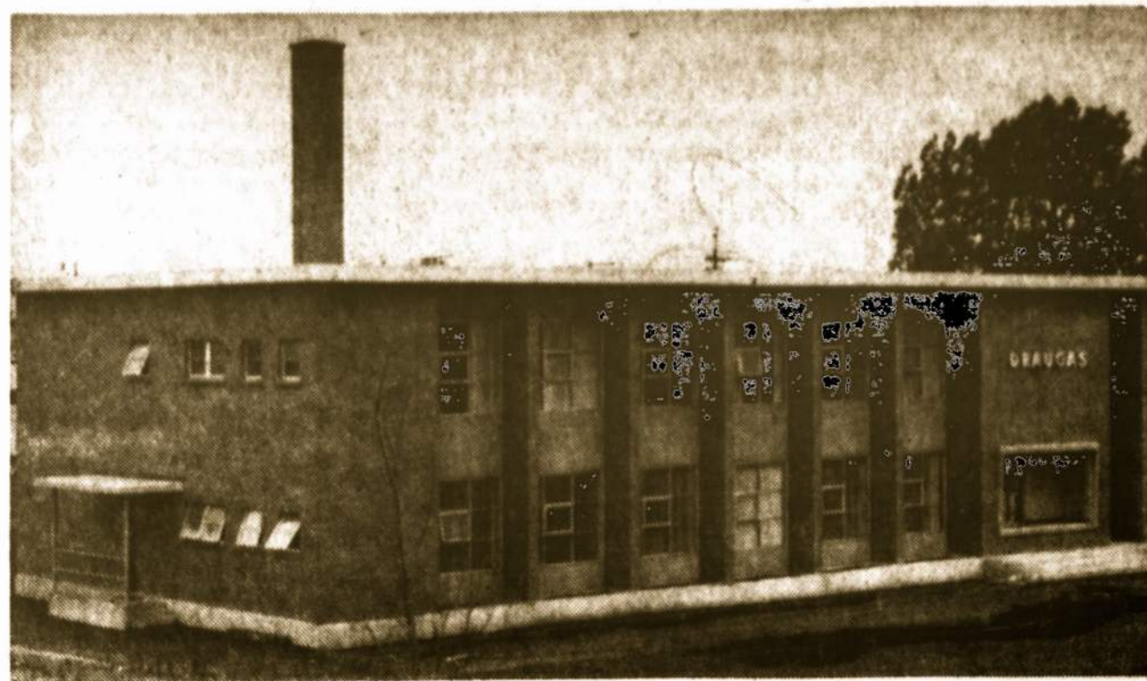
The new offices of the "Draugas". The printing plant extends to the west along 63rd street.