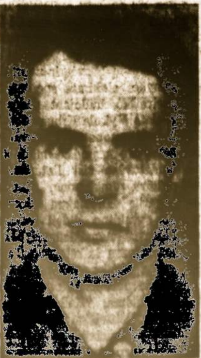
Lietuvio jūrinių Simas Kudirka ir jo žmona Ona. Nuotrauka pavaite paskeibe kongreso užsienio reikalų tyrinėjimo pakomisija.