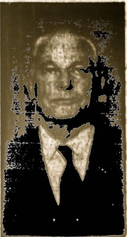
Thomas J. Dodd, būv. Conn. senatorius gegužės 24 mirė Old Lyme, Conn. Buvo pagarsėjęs kaip komunistinis priešinys ir pavertėjęs tautų bei lietuvių draugas. Gubernatorius T. Meskill gegužės 30 paskelbė valstijos gedulo dieną.