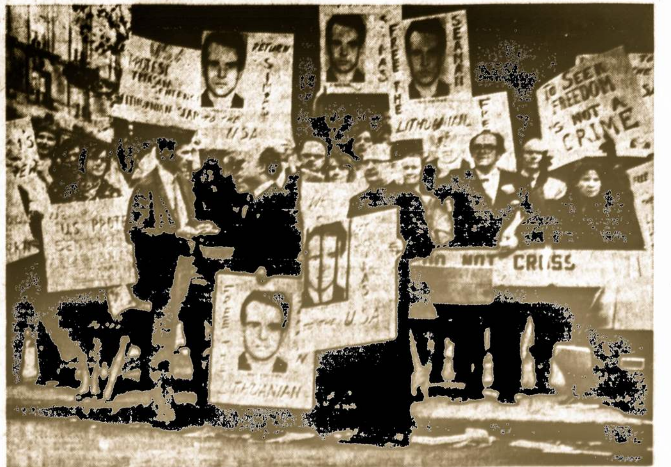
Lietuvių demonstracijos New York'e gegužės 27, kai buvo paskelbta žinia apie šimo Kudirkos nutėlimą. Demonstracijos buvo prie Sovietų Pasitūnybės prie JT.

— Artistė Rūta Lee-Kilmoney šių metų liepos mėnesį dalyvaus tarptautiniam filmų festivaly Maskvoje.