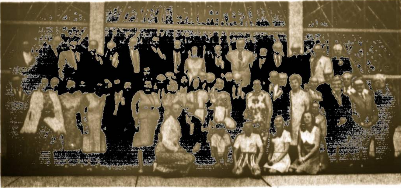
Bendra 65-jo Seimo atstovų grupė.

P. O. Box 32 (71-73 S. Washington St.), Wilkes-Barre, Pa. 18703