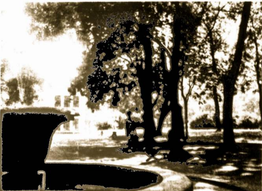
Kauno teatro sodelis. Kryželiu pažymėtoje vietoje susidėginomas Romas Kalanta.