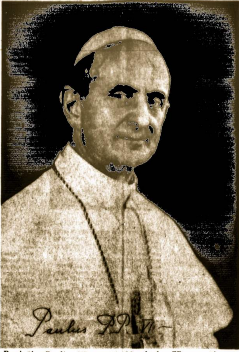
Popiežius Paulius VI, rugsėjo 26 sulaukęs 75 m. amžiaus.

Norintieji darbuotis JAV diplomatinėje srityje ar US Information Agency, gali laikyti nustatytus egzaminus. Kandidatai ar kandidatės turi būti Amerikos piliečiai nemažiau kaip 7 1/2 metų ir nejaunesni kaip 21 m. amžiaus. Aplikacijoms gauti reikia rašyti: The Board of Examinations for the Foreign Service, 7113 Department of State, Washington, DC, 20520. (Elta)