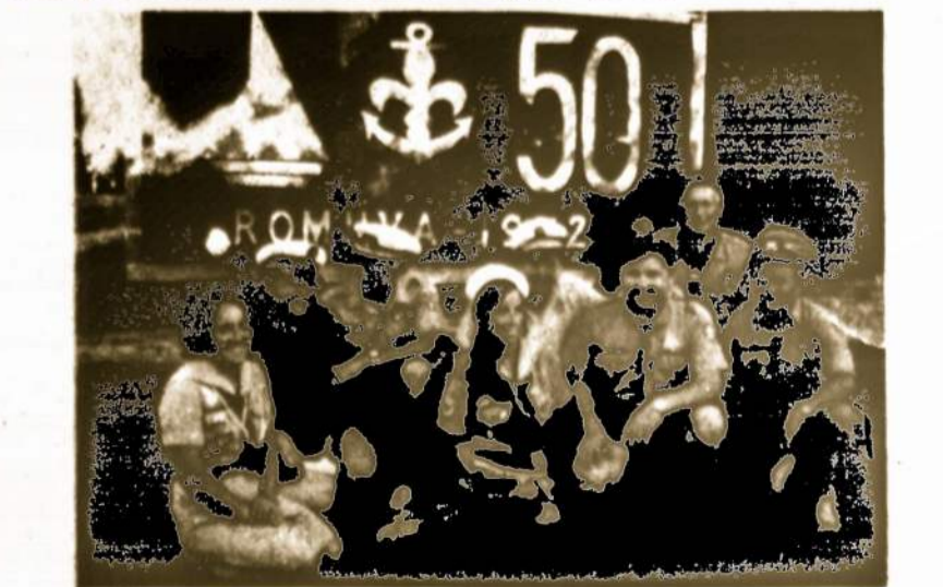
Jūros skautų 50-ties metų sukaktį paminėti jubilėjinės stovyklos vadovai. Stovykla vyko Romuvos stovyklavietėje Kanadoje.