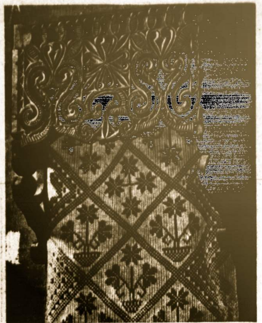
Rankšluostinė. Lietuvių liaudies drožinys. Tokios rankšluostinės kabėjo seklyčioje. Į jas buvo įvertas lietuvių gražus audinys — raštuotas rankšluostis.