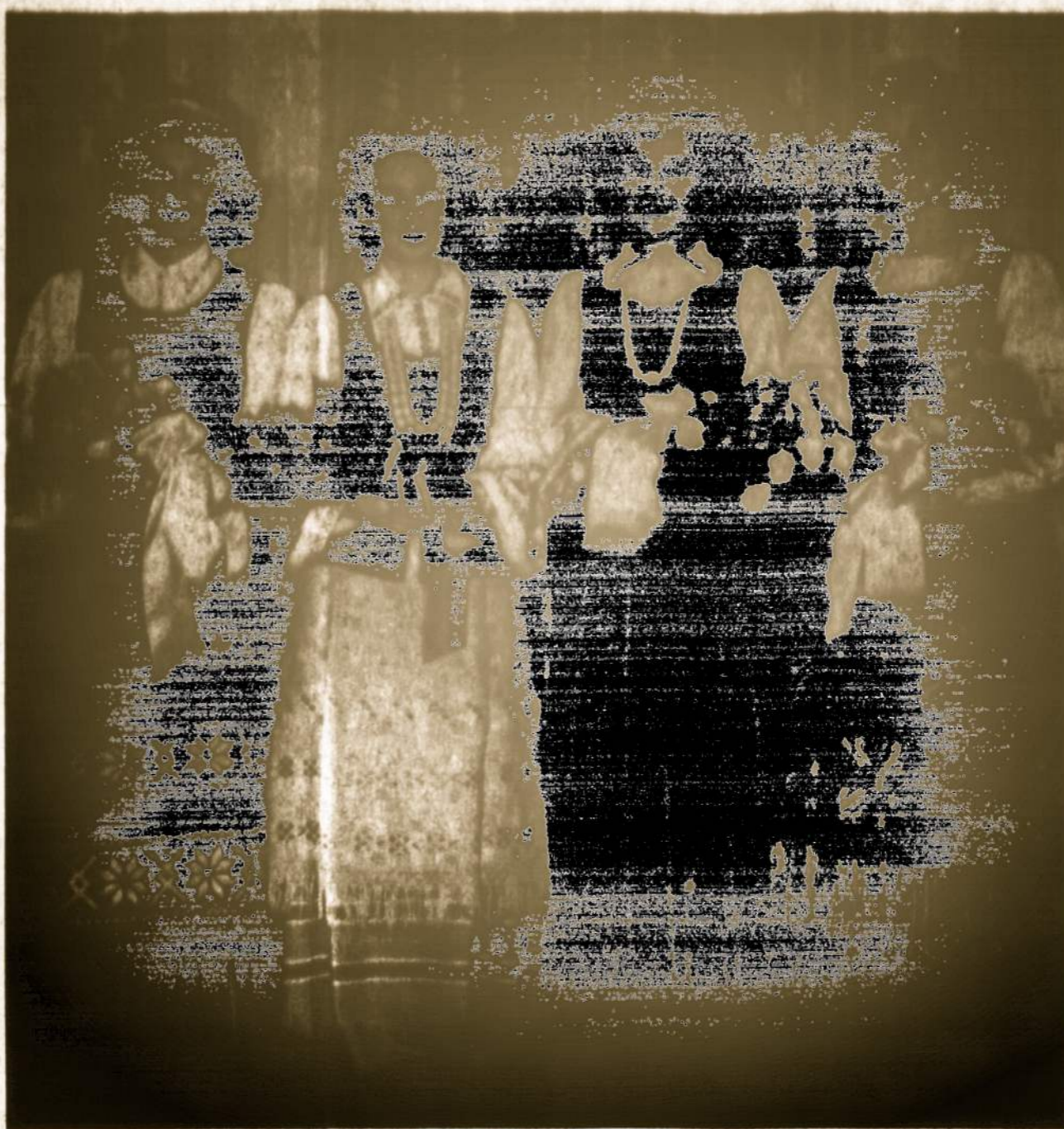
Four young ladies of a bridal party demonstrate the colorful variety that is worked into the patterns of Lithuanian costumes.

Romas Kalanta — student, worker, Catholic — symbolizes the forces that spearhead Lithuania's freedom struggle. The flames of his self-immolation are thus not only consuming but, in their power to inspire, also life-giving.