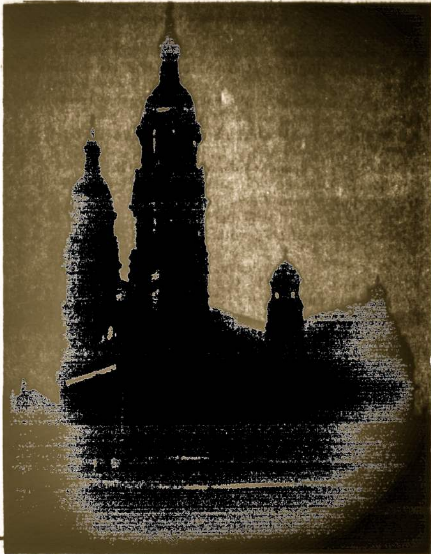
Holy Cross parish church, Chicago, Ill., one of our more beautiful Lithuanian churches.

It is a generally proposed fact that Lithuanian parishes throughout the nation are either sick, dying or dead. This outlook is a rather gloomy one and provides hope for no one — neither the Lithuanian as a Lithuanian, nor the Lithuanian community as a community, nor the Lithuanian priesthood in so far as the vineyard is the Lithuanian community.