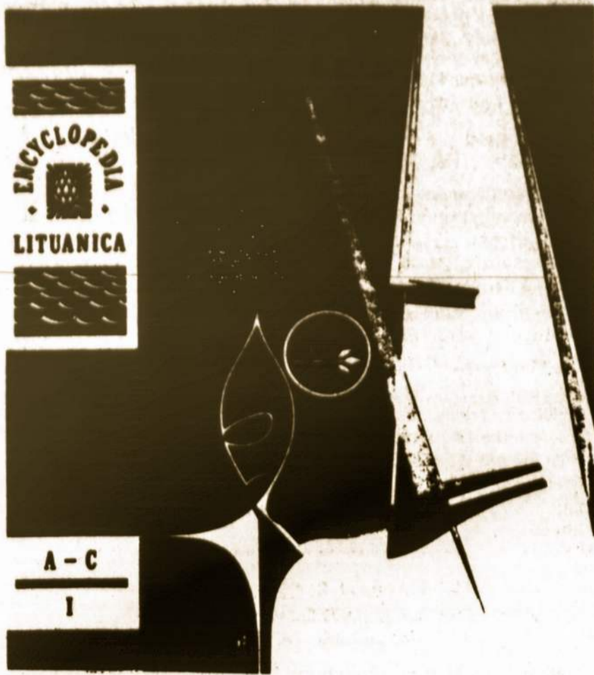
The dust jacket of the "Encyclopedia Lituanica"