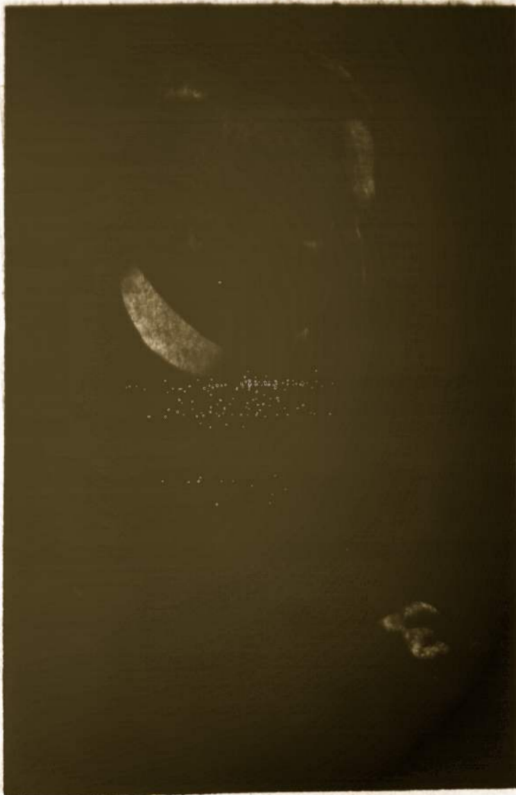
Ā. a. kanauninkas Mykolas Vaitkus

Providence, R. I. — Sekmadienį, gegužės 20, 6:20 ryto, po dviejų savaitių sunkios ligos, mirė žymus lietuvių poetas ir rašytojas kanauninkas Mykolas Vaitkus, 90 metų amžiaus.