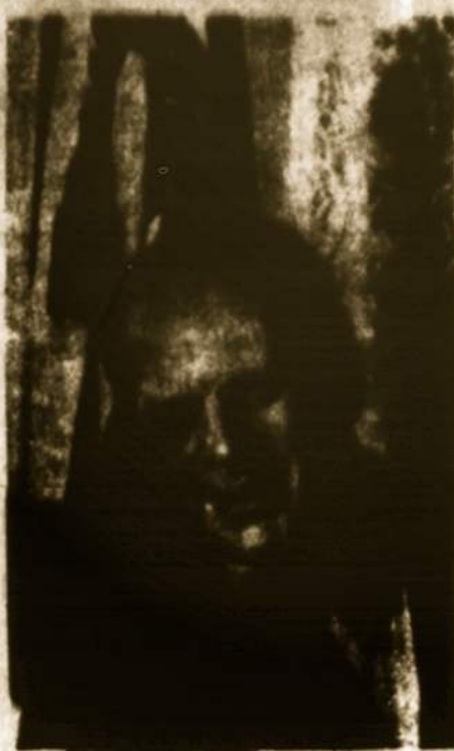
GERALD R. FORD

Washington, D.C. Buvusiam viceprezidentui Spiro T. Agnew dėl nesumokėtų pajamų taksų ir kitų apkaltinimų iš viceprezidento vietos rezignavus, prezidentas Nixon be atidėliojimo pradėjo ieškoti kandidato užimti vietą. Parinkdamas kandidatą, prezidentas perėjo daugybę asmenų, arčiausia apsidomamas prie buvusio valstybės išdo sekretoriaus John B. Connally, New Yorko gubernatoriaus Nelson A. Rockefeller, Kalifornijos gubernatoriaus Ronald Reagana, buvusio valstybės sekretoriaus William P. Rogers ir senatoriaus Hugh Scott. Galutinai pasirinko Atstovų Rūmų respublikonų