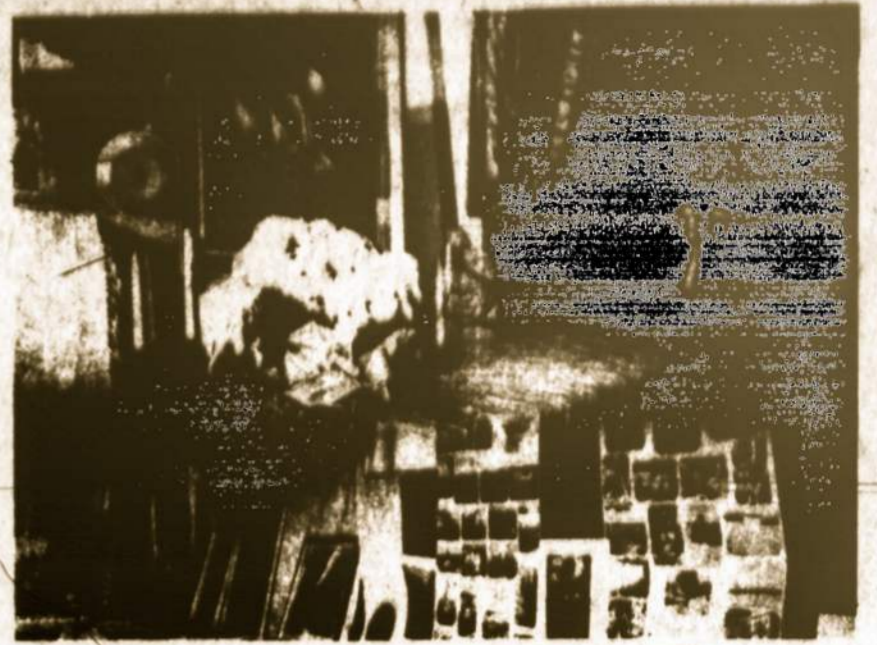
Vilniaus 650 metų sukakties minėjimą Los Angeles mieste spalio 28 surengė Ramiojo vandenyno skautų rajonas. Nuotraukoje — Vilniaus parodos kampelis.