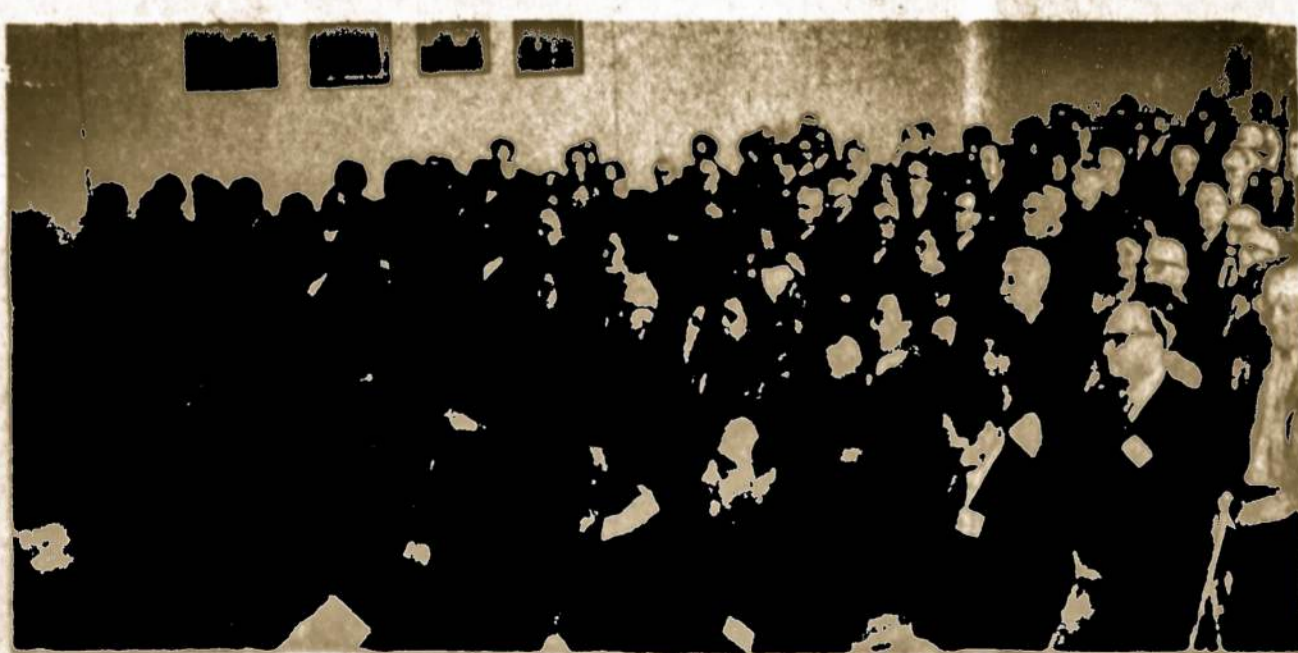
Mokslė ir kūrybos ontroje simpoziumo dalyviai, Chicagoje, Noor. Z. D. su foto

ženicinas sako, kad jis negali tylėti, gerai žinodamas kančias, kokias pereina politiniai kaliniai iki jie nukankinami ir kad jis laiko savo prievole kalbėti už tuos, kurie neturėjo ir neturi galimybės apie jų kančias ką nors paskelbti.