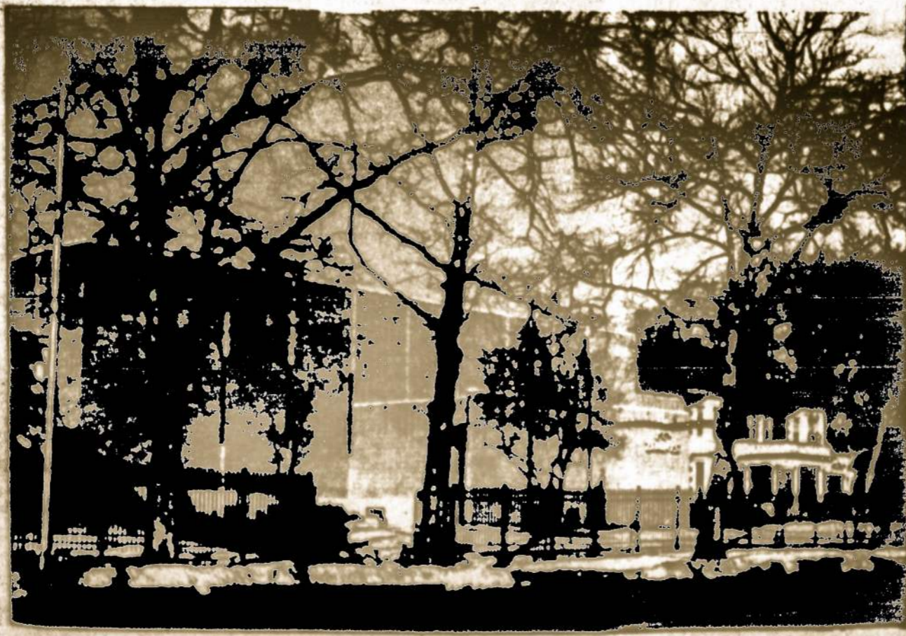
Lietuvių Kultūrinis Židinys, Brooklyn, N. Y. pastatai, kurių iškilminga dedikacija įvyko 1974 m. vasario mėn. 10 d. Šiuose pastatuose įrengtoji "Darbininko" spausdėjų surenkamas-sudaromas mūsų Susivienijimo laikraštis "Garsas".