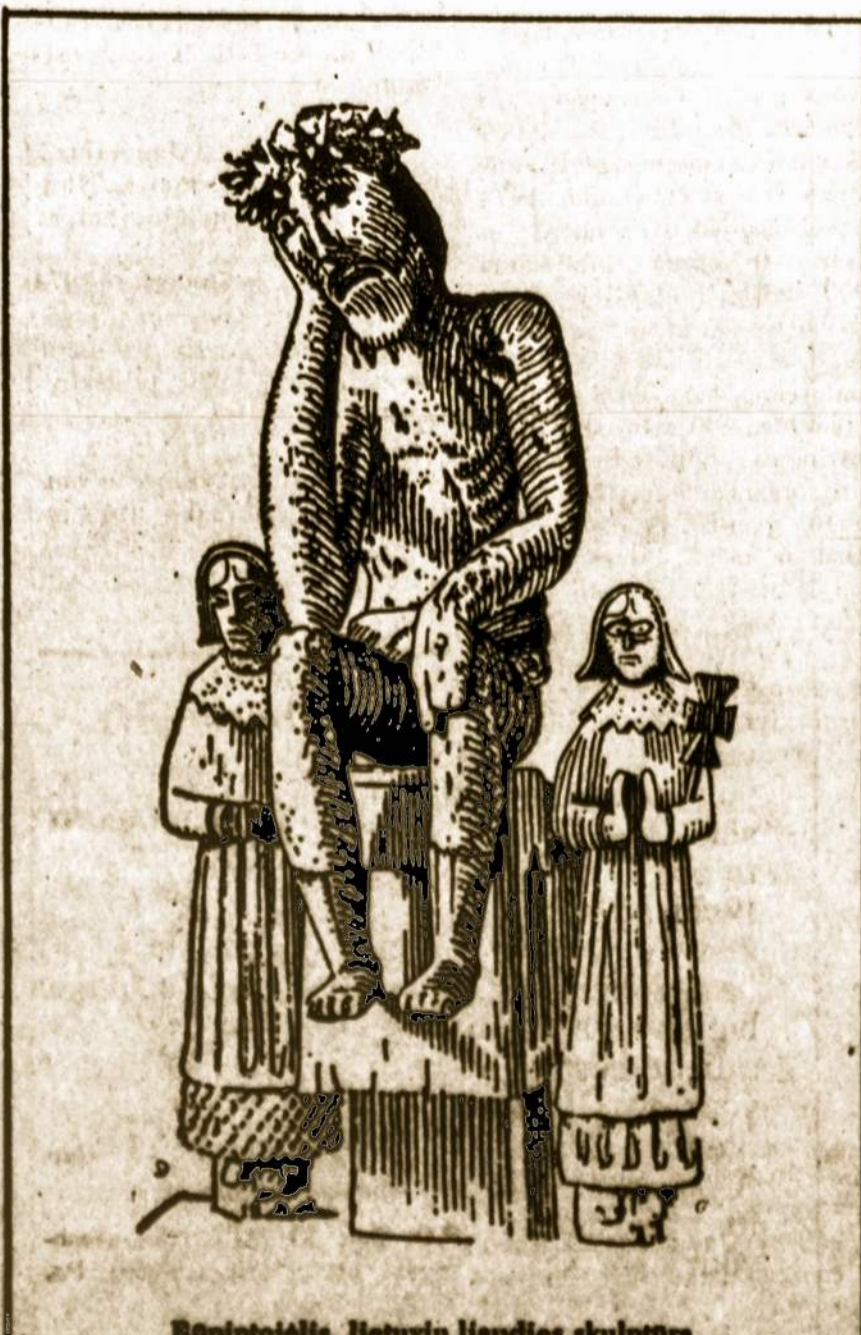
Rūpintojėlis, Lietuvių liaudies skulptūra