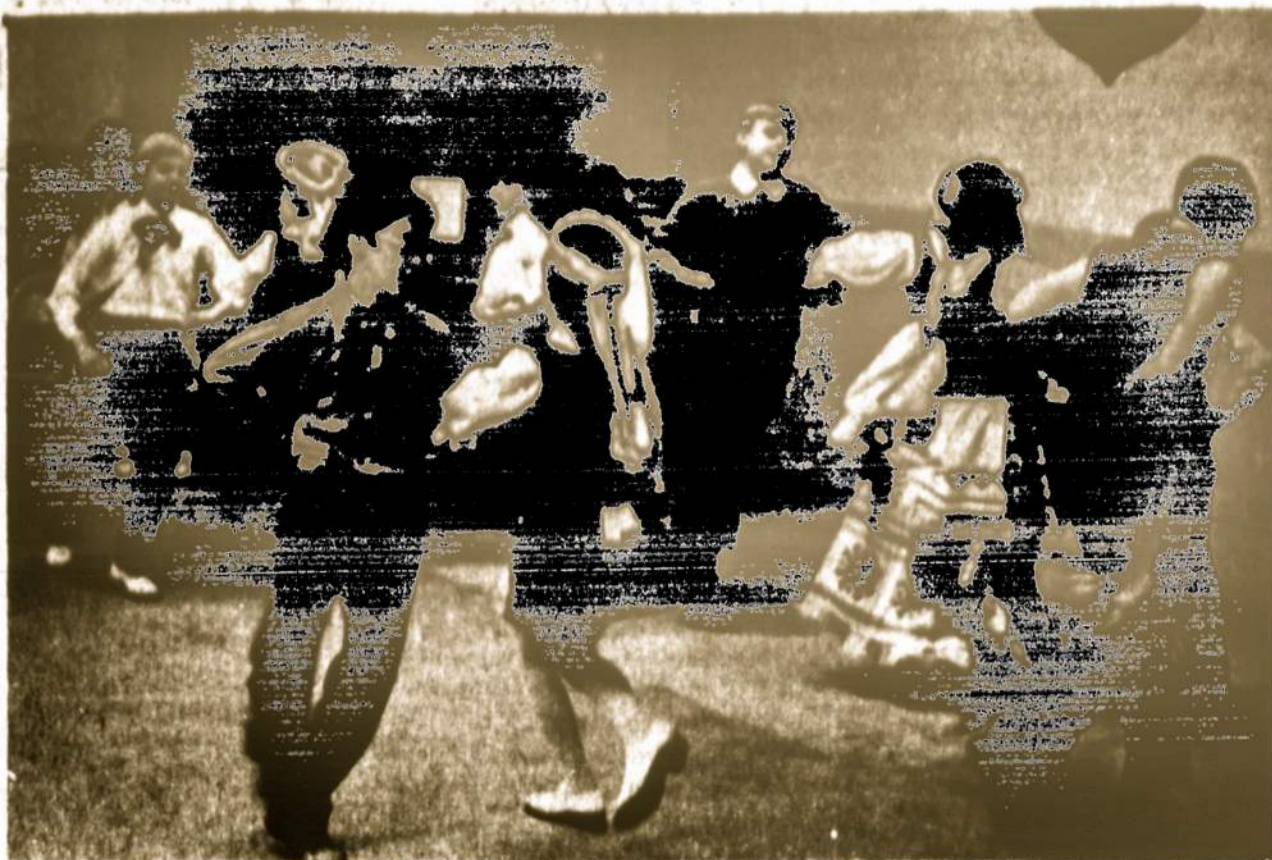
Hartfordo, Conn., liuanistinės mokyklos jaunesniųjų mokinių grupė šoko tautinius šokius.