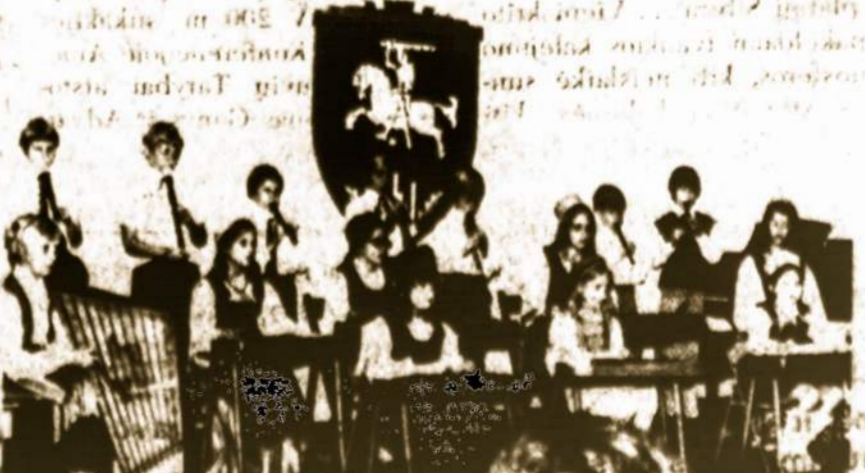
Naujas Clevelando orkestrėlis, kurį suorganizavo muzikas A. Mikulskis.