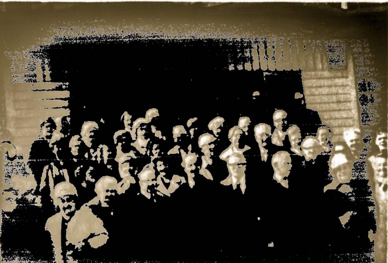
Kat. Federacijos New Yorko apskrities seimelio dalyviai balandžio 27 prie Maspetho Lietuvių parapijos bažnyčios.