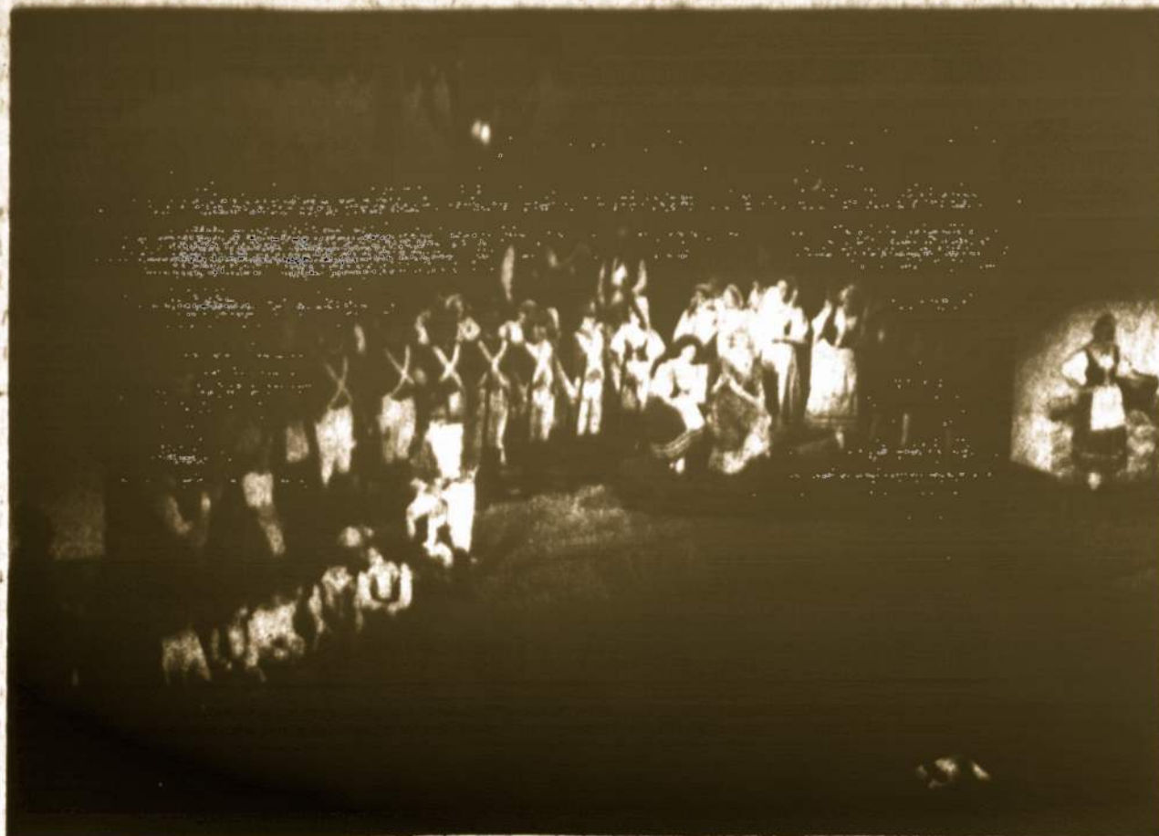
"Meilės eleksyras" — šių metų lietuvių operos pastatymas Chicagoj.

"As I would not be a slave, so I would not be a master. This expresses my idea of democracy. Whatever differs from this, to the extent of the difference, is no democracy".