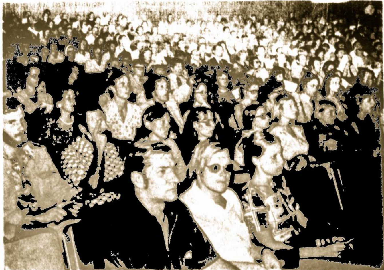
Buenos Aires atidarant III PLJ kongresą. Salėje matome dalį jaunimo.

Užsakymus siųsti: "Garsas", P.O. Box 32 (71-73 So. Washington Str.), Wilkes-Barre, Pa. 18703