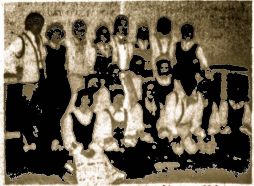
Baltimoras ir Washingtono tautinių šokių grupė Malinas