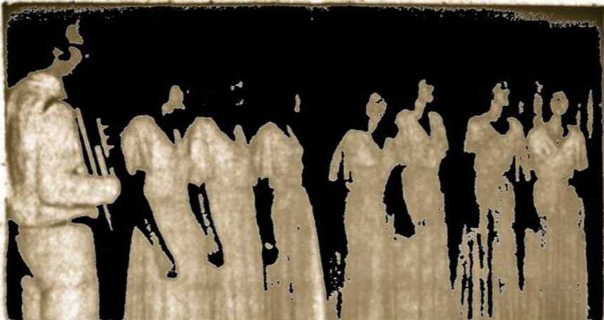
Trečio jaunimo kongreso proga Urugvajų ir Brazilijoje pasirodė Argentinos Lietuvių oktetas "Zibutės".