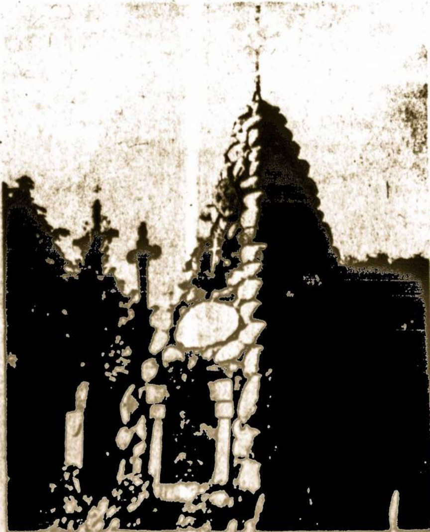
Pasipikis Žuvusiųs už Lietuvos Nepriklausomą —

Minot, N.D. — Balandžio 19 paskelbta, kad dėl potvynio 12 tūkstančių Minot gyventojų turėjo apleisti namus.