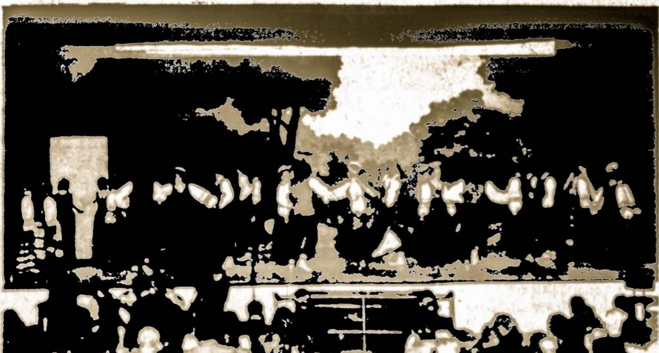
Grandinėles tokėjai, atlikdami Laisvės Žiburio radijo programą, pagerbdami Ameriką 200 m. jubiliejaus progą, pašoko "Virginia Reel".

Visiems aukotojams išduodami kvitai, ir jų sukoms Amerikoje yra atleidžiamos nuo federalinių mokesčių.