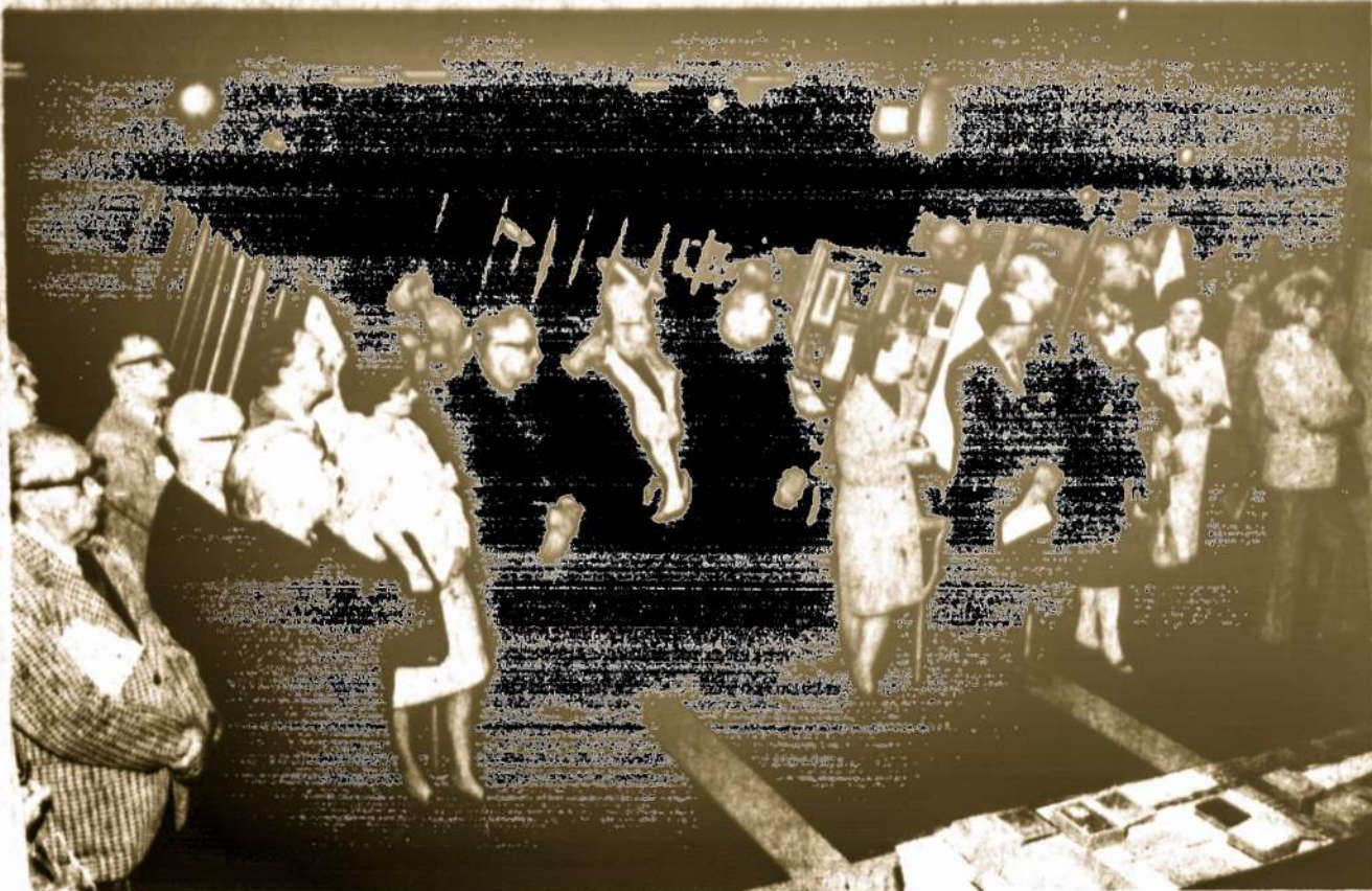
Lietuvių išeivijos paroda buvo surengta Chicagoj balandžio 3-4 Jaunimo Centre. Čia matome parodos stendus ir dalį lankytojų.

"You should not take too seriously the treaties we make with the imperialists. Lenin, too, signed a treaty after World War I, that remained valid only so long as it proved necessary" — (Krushchev, to East Germans, 1959)