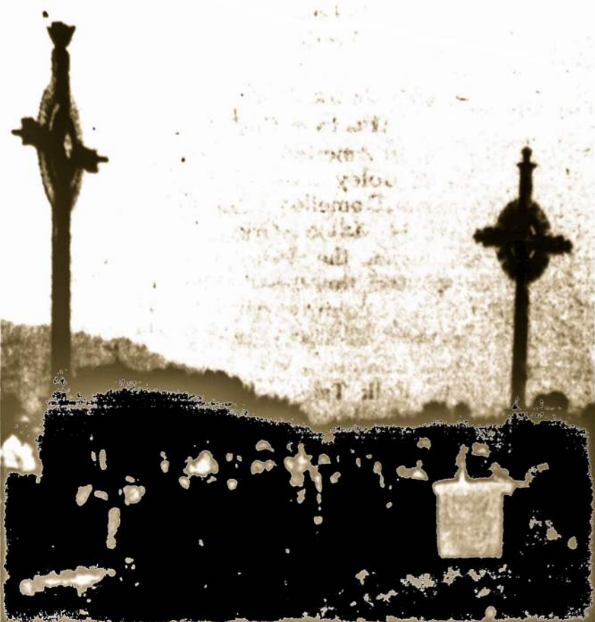
Mokytojų ir jaunimo savaitės pamaldos prie naujai pastatytų ir pašventintų kryžių Dainavoj.

Užsakymus siųsti: "Garsas", P.O. Box 32 (71-73 So. Washington Str.), Wilkes-Barre, Pa. 18703