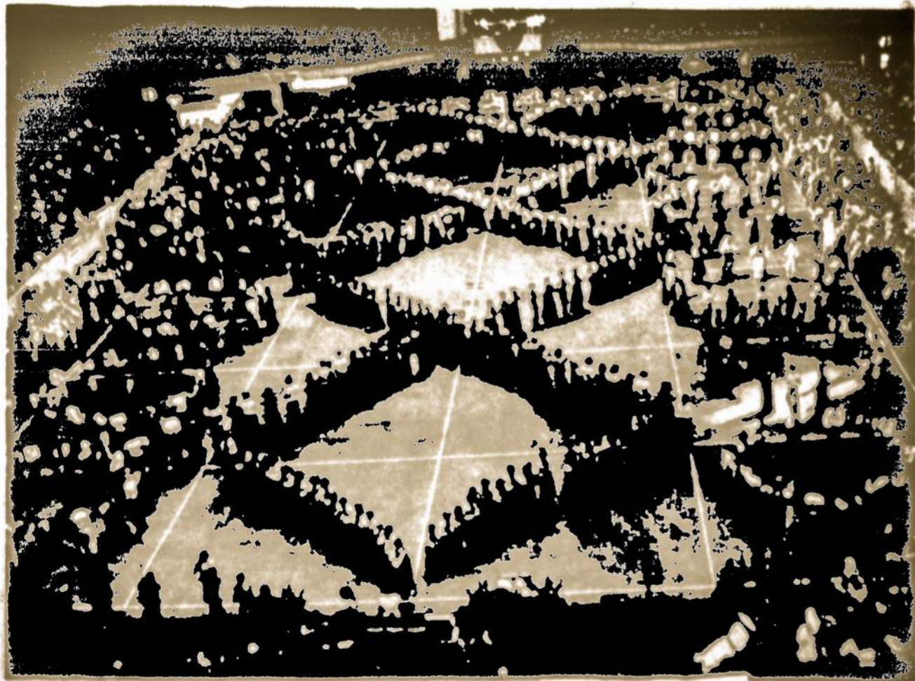
Valdas ir penktosios tautinių šokių šventės.