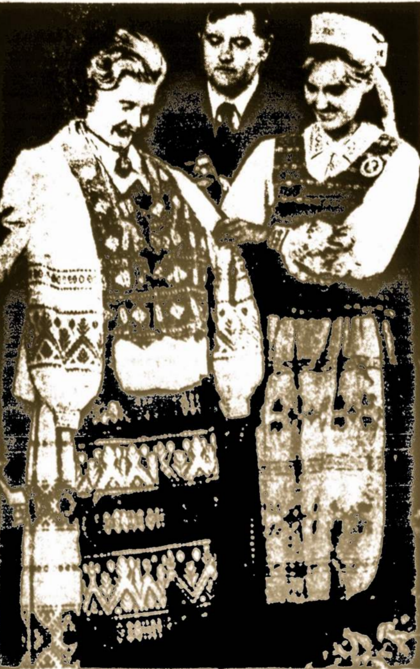
Tautinių šokių šventėje prezidentienė Mrs. Betty Ford apdovanojama lietuvių tautiniu kostiumu. Apdovanoja viena šokėja. Viduryje — Valdas Adamkus, iškilnių vadovas. Šią nuotrauką įsidėjo Chicagos Sun-Times rugsėjo 6 laidoje.

Šio generalinio naujų narių vąjus laiku — iki 1977 metų birželio mėn. įrašyk į Susivienijimą ne mažiau 12 narių, su 1,000 dolerių apdrauda kiekvieną.