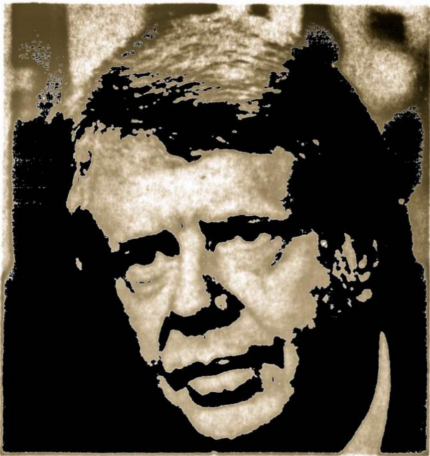
Lapkričio 2 išrinktas naujas JAV prezidentas Jimmy Carter