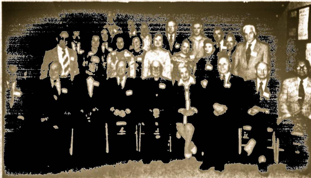
Tautos Fondo III-čioje susivienijimo atstovai ir svečiai Kultūros Židiny gegužės 28.

Tautos Fondas yra paskelbęs TF šimtinių vaju. Tokie asmenys (ar organizacijos) kasmet aukoja bent vieną šimtą dolerių. Aukos Tautos Fondui yra atleidžiamos nuo JAV mokesčių. Čekius rašyti šiuo adresu: Tautos Fondas, P.O. Box 21073, Woodhaven, New York 11421. (Elta).