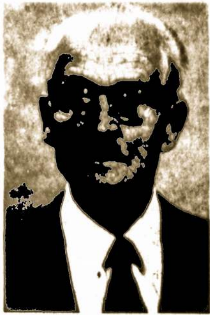
Vincas J. Kudirka

Dar vienas Susivienijimo veikėjas veteranas pergyveno apdraudus mirtingumo lentelę ir jam dar gyvam Susiv. išmoko pilną apdraudą.