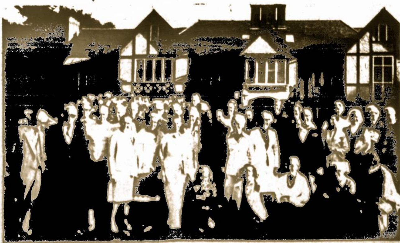
Ateitininkų sendraugų stovyklos dalyviai Kennebunkporte š.m. rugpiučio mėn.

A public service of the Securities and The Advertising Council.