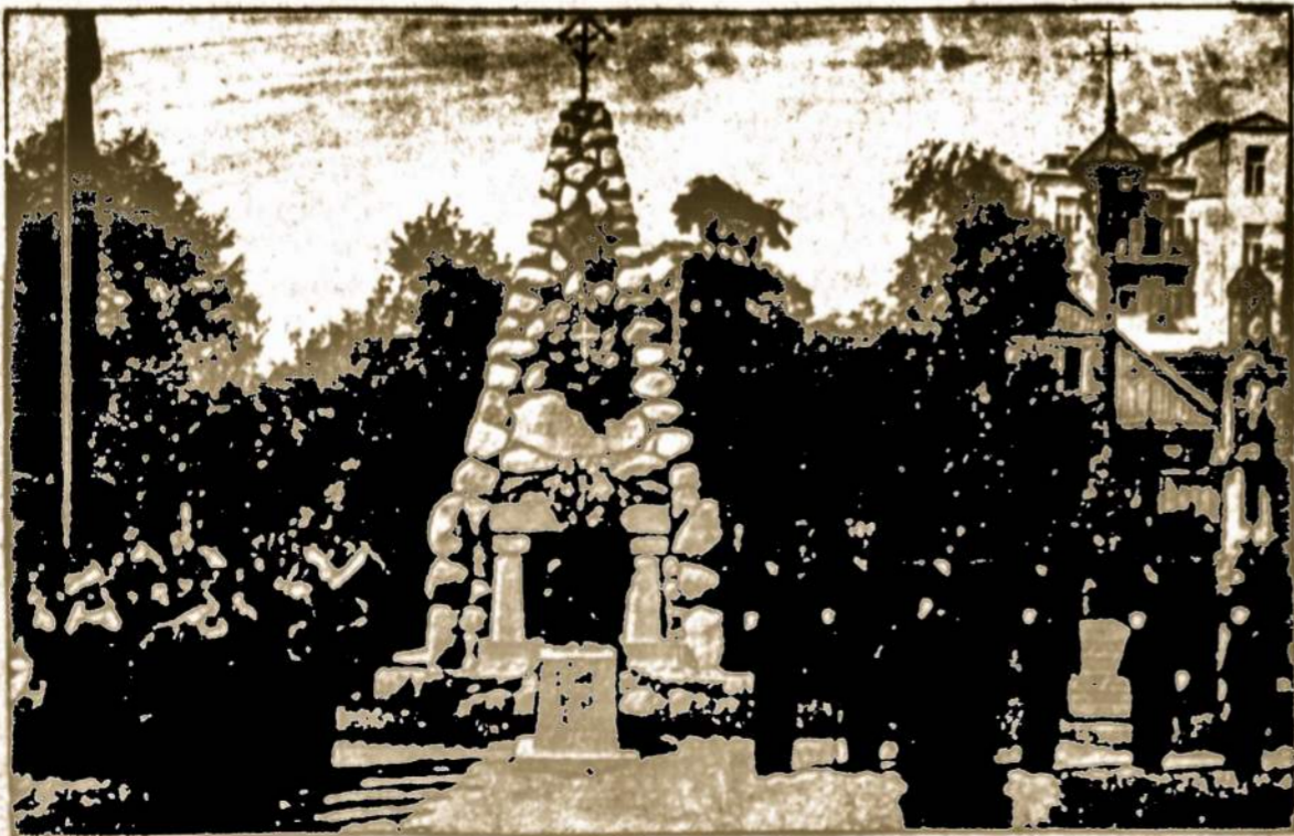
Nežinomo Kareivio kapas, pastatytas iš akmenų, kur buvo kautynės dėl Lietuvos laisvės. Nusidžiama vėliava. Groja karo invalidų orkestras. Nepriklausomos Lietuvos laisvę išvykdo pešios svarbiausios iškilinės Vasario 16 šventės proga.

Šiais 1978 seiminiais metais kiekvienas Susivienijimo narys-narė turėtų laikyti svarbia pareiga nuodirdžiai padirbėti savo organizacijos naudai, didžiausią dėmesį atkreipti į narystės didinimą. Yra trys vjaus kontekstai su reguliariais komisais ir specialiais atyginimais. Savo nuožūra pasirinkę jums patraukliausią kontekstą, pasistenkite įvykdyti nustatytas kvotas ir laimėti komisus ir visus kitus atyginimus.