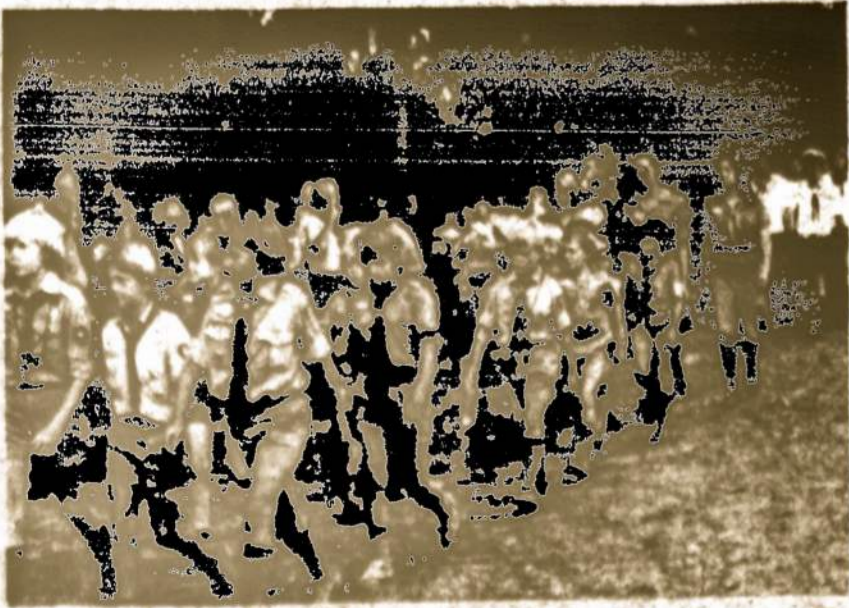
Australijos lietuviai skautai ir skautės parade.

The Pennsylvania Department of Health urges everyone to check their immunization records. If immunizations are needed, make an appointment with your family doctor or the immunization clinic.