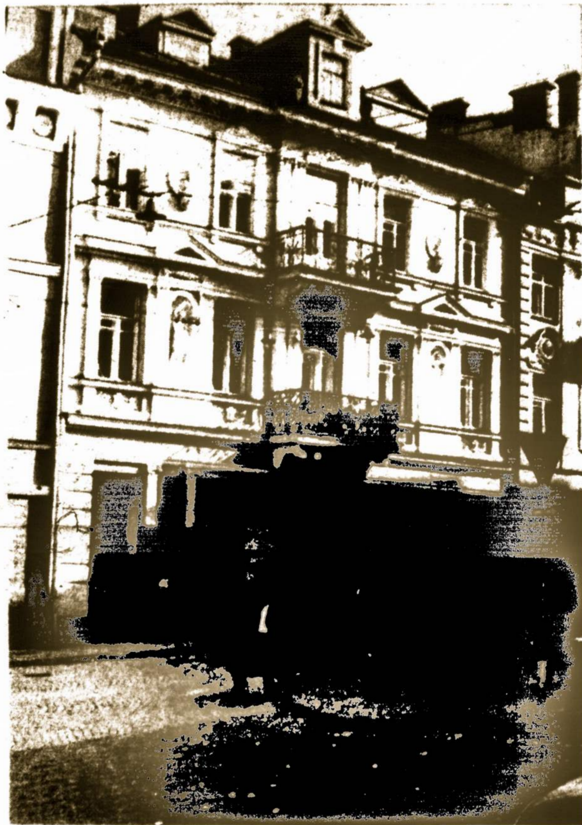
Namas Pilies gatvėje Vilniuje, netoli šv. Jono bažnyčios kur antrame aukšte buvo Lietuvos Tarybos būstinė. Čia ir posėdžiavo Lietuvos Taryba 1918 metais vasario 16 ir čia paskelbė Lietuvos nepriklausomybės atstatymą.

Ta pirmoji lietuvių inteligentų karta ėmė ir paskaitė Simano Daukanto istoriją. Jie ir suprato, kad Lietuva yra čia, kad