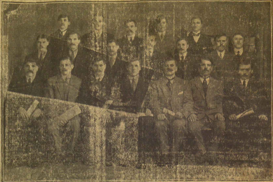
Uddingstono L. K. D. Sąjungos kuopa.

Aiškus tikslas Sunday Post, tik juokai kad norėdami valdžiai įduoti reporteriai parinko „apkaltinančius“ straipsnius kaip tik šaltesnius, aplenkdami tikrai priešvaldiškus Matyti, kad rinkosi tie, ką lietuvių kalbos nepažįsta.