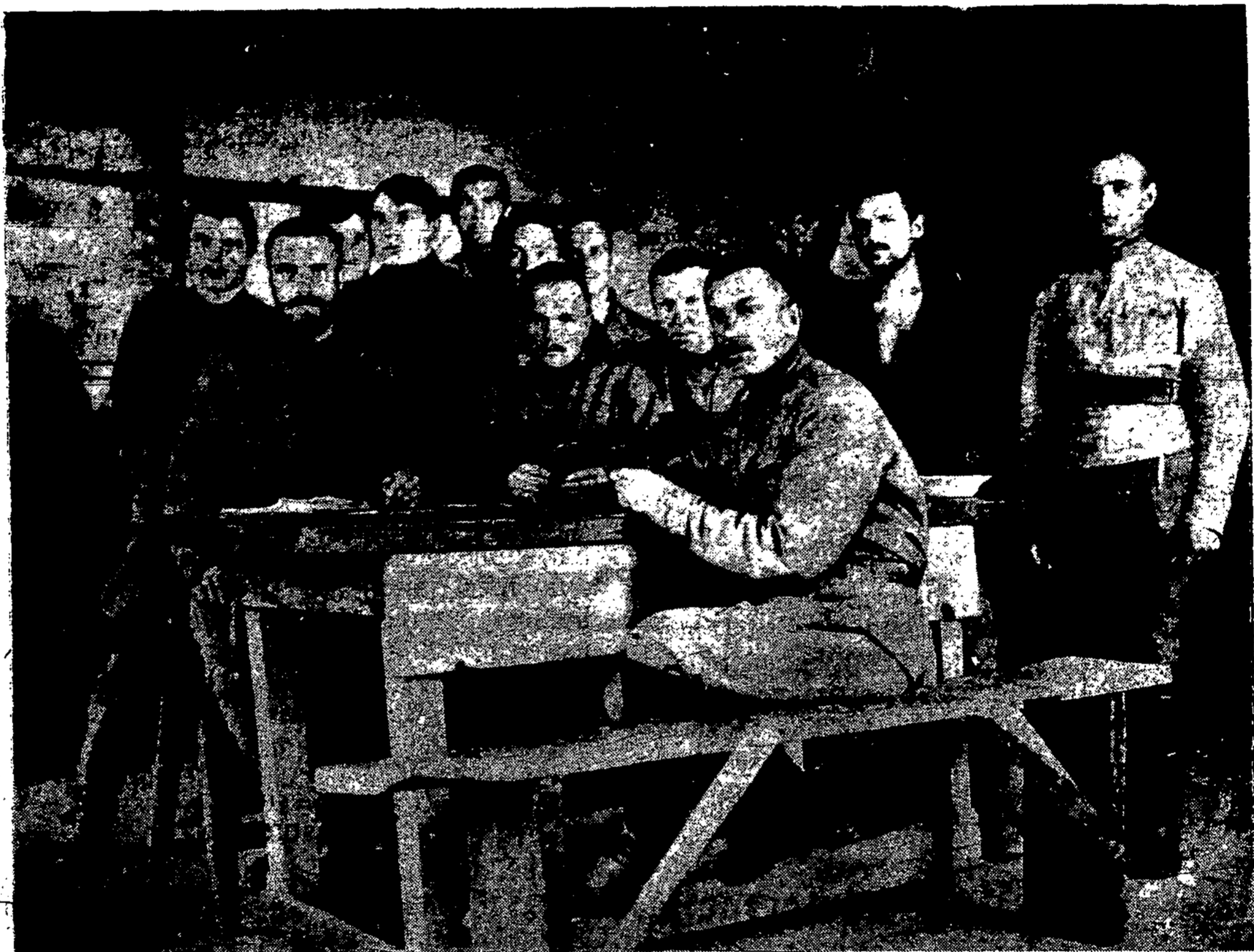
Iš mūsų kovos su bolševikais dėl Lietuvos Nepriklausomybės 1919 m. bolševikų karininkai bei komisariai lietuvių nelaisvėj (Kauno belaisvių stovykloj).

kad tik nustatyti 1923 m. kariuomenės skaičių visose konferencijos valstybėse o jau vėliau išdirbti būdus tolimesniai sumažinimui, rusai nusileido ir sutiko svarstyti tik sumažinimą kol kas vienu ketvirtadaliu, t. y. nustatė tik 1923 met. kar. kontingentą (skaičių). Čia visi atstovai, išskiriant lietuvių kurie pareiškė kad sutinka principaliai sumažinti 25% bet konkrečių davinių neduos, paskelbė kiek kuri valstybė turi kariuomenės ir kiek sutinka palikti 1923 m., imant dėmėn kariuomenės sumažinimą vienu ketvirtadaliu.