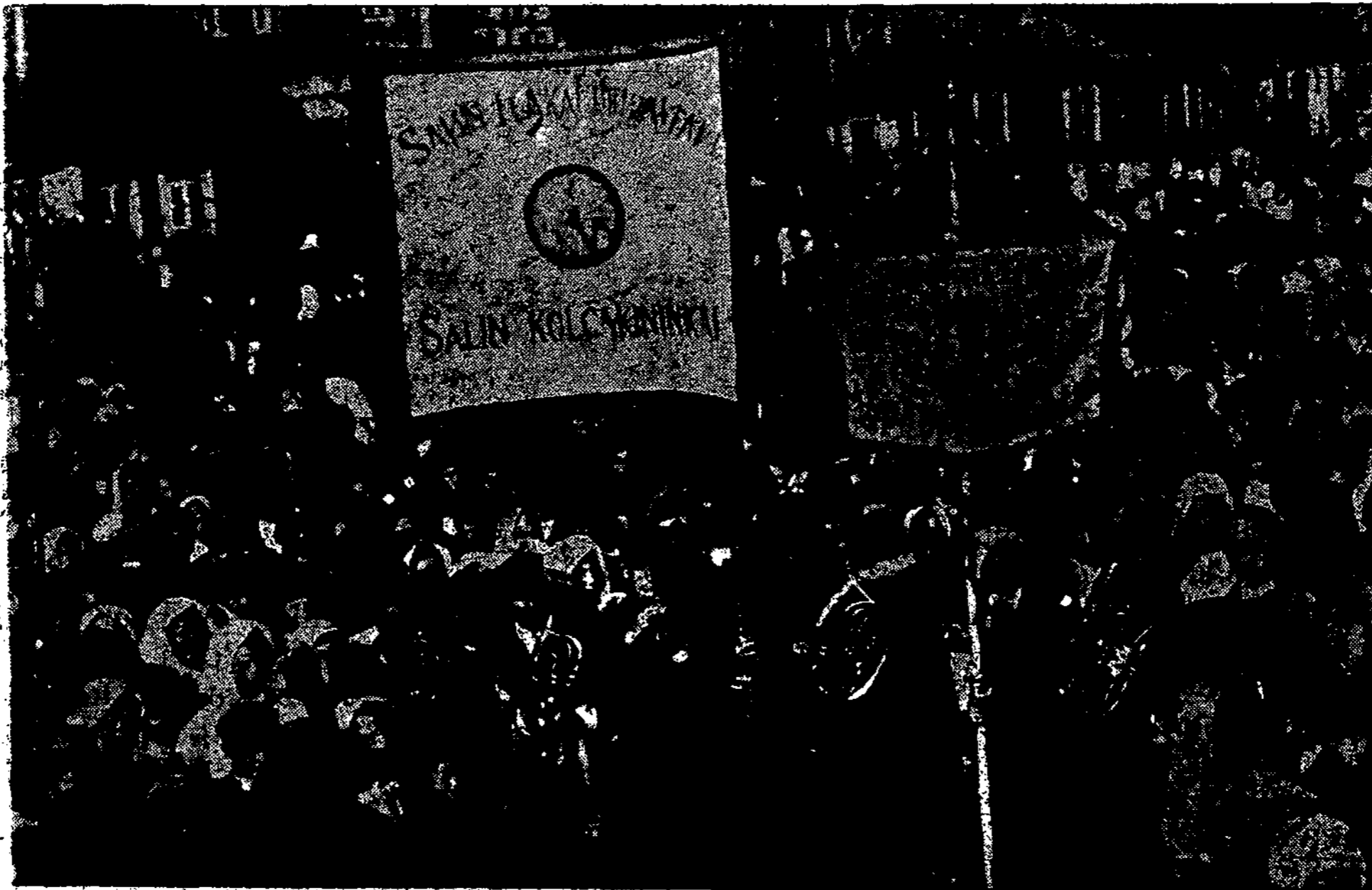
Ziūrėdami į šių dienų mūsų visuomenės sujudimą dėl Klaipėdos, prisiminkime, kaip mūs visuomenė buvo sujudus mūs kruvinoj kovoj su kolčakais ir besiveržiančiais Lietuvos lenkais ar bolševikais. Lietuvių padėtis tada buvo itin sunki ir vistiek mes laimėjom.

Pastaruoju laiku išdirbamas armijos reorganizacijos projektas, kuris permato žymiai padidinti armiją. Numatoma padidinti kiekybę, kasmet šaukiant nau-