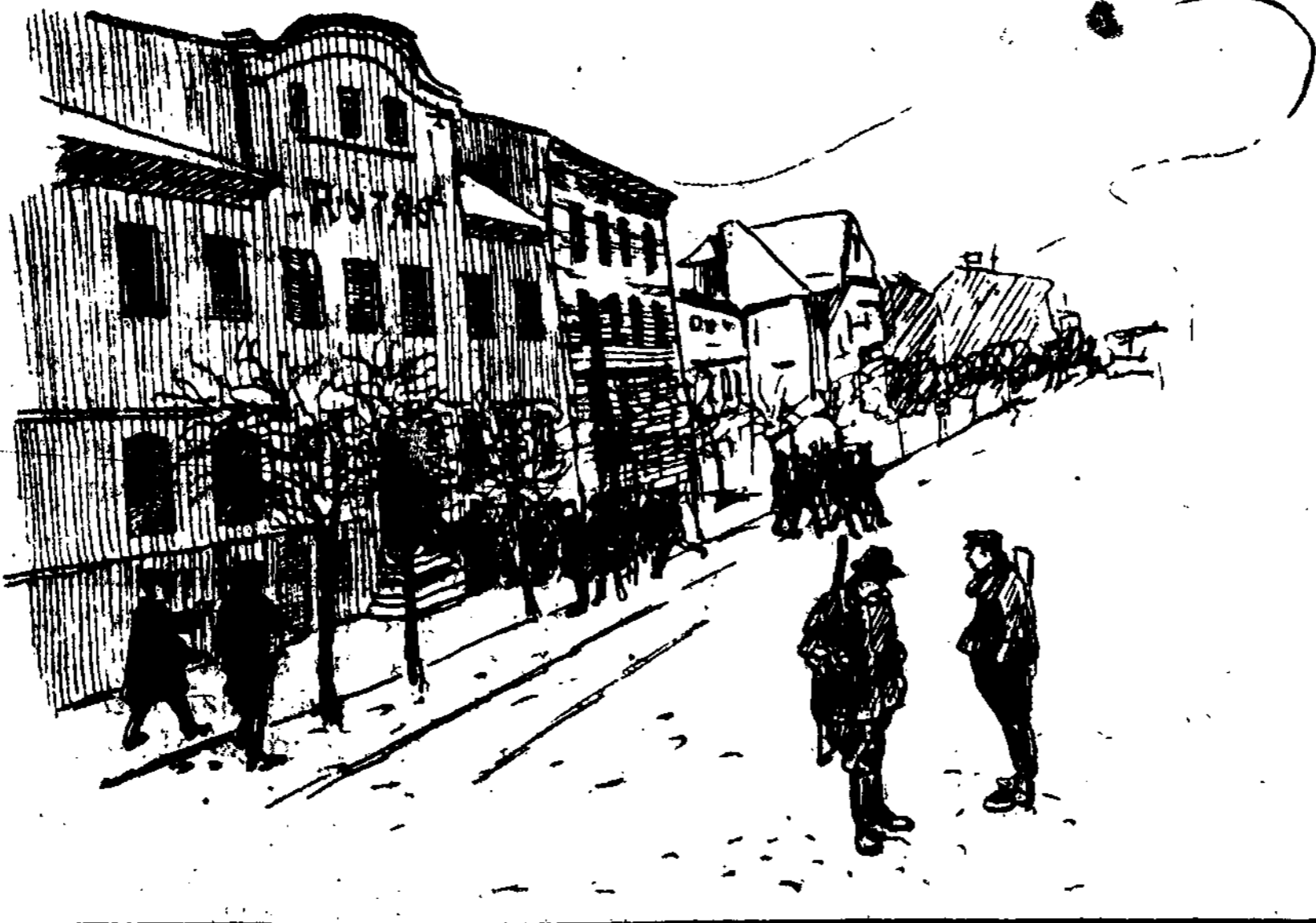
Klaipėdos gatvėse sukilimo metu. Sukilėliai, įsivrežę miestą, daboja gatvių tvarkos.

tuvių, elektros stočių ir tt. Iš viso dabar turime 285 didelius fabrikus ir apie 6000 dirbtuvių, fabrikėlių ir t. t. Iš fabrikų pažymėtini: skerdykla ir šaldykla, 2 stiklo fabrikai, betoninių dirbinių, 2 popierio fabrikai, virvių dirbtuvė, linų apdirbimo ir įvairūs