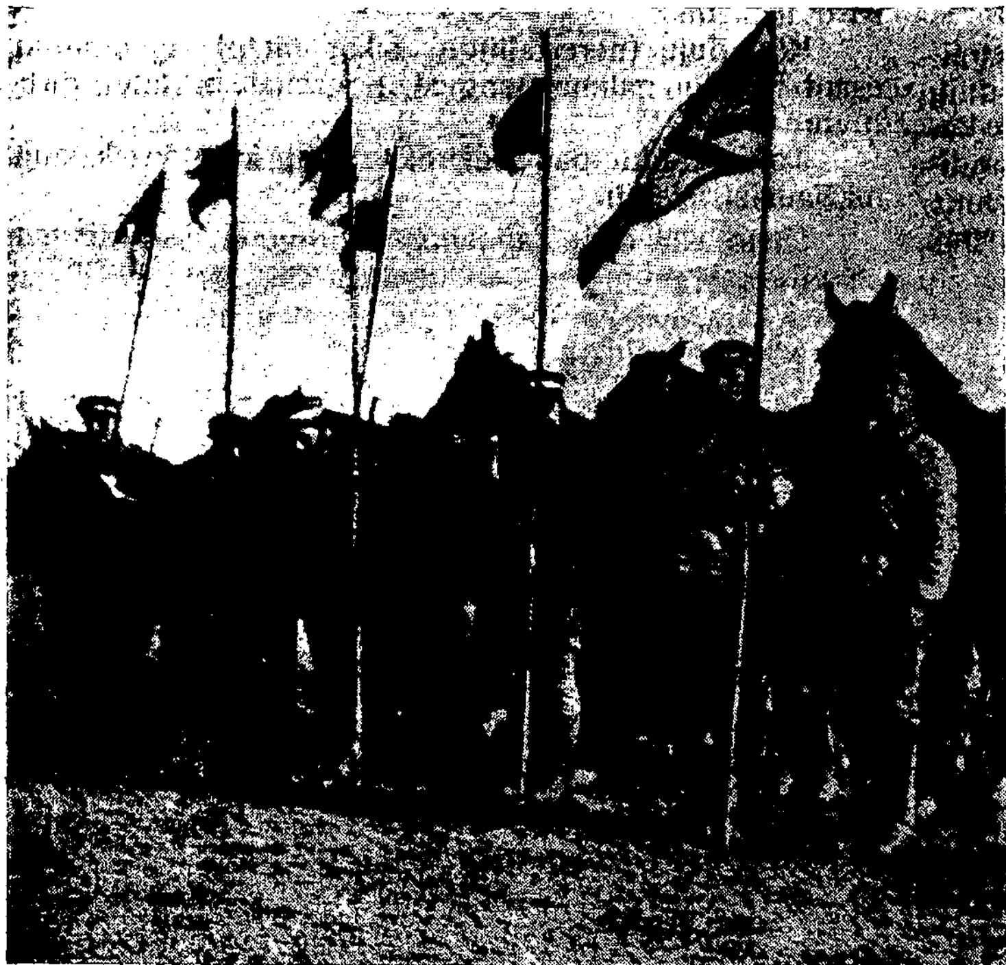
Mūs pirmieji raiteliai 1919 metais. Tada vyrai kariškai buvo dar neišlavinti, arkliai menki, neparinkti, tačiau kovose su priešais sugebėjo pasižymėti.

Jeigu jiems primetama, kad vis vien negerai yra užmušinėti žmones, nors ir kulkomis bei granatomis, tuomet nuodingų dujų karo priešai atsako: nors kulkomis ir granatomis užmušama didesnis skaičius žmonių, bet delto padarytos jomis žaizdos ir pakenkimai