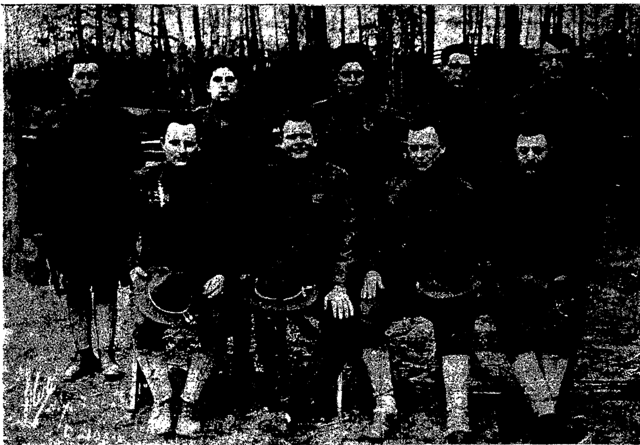
Amerikonai savanoriai mūsų kariuomenėj 1919 m.

Ča yra proga sulyginoti latvių ir estų vaisius.