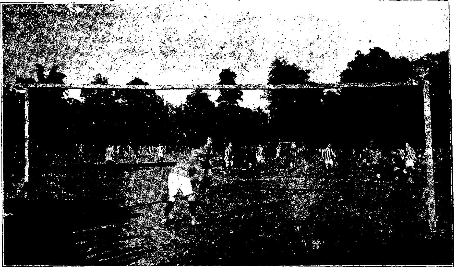
Futbolo rungtynės, įvykusios 1922 m. birželio 8 d. Kaune—Ažuolyne, tarp Lietuvos Fizinio Lavinimosi Sąjungos ir Latvių Rygos futbolo komandos „I. M. C. A.“ (Apie tas rungtynes buvo rašyta 1922 m, „Kario“ 25 (161) Nr. „Sportas“),