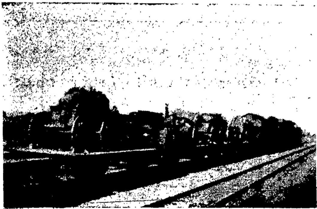
Iš kovos su bermontininkais gadynės 1919 m. Paimtas kovojties Radviliškiu grobis gabenamas Kaunan.

Ats. 124. Kareiviai, patrauktieji teisman ir areštuojami, už visą laiką sėdėjimo daboklėje arba kalėjime algos negauna; taip pat nemokama alga kareiviams, nuteistiems, daboklėn arba kalėjimu, atliekant jiems