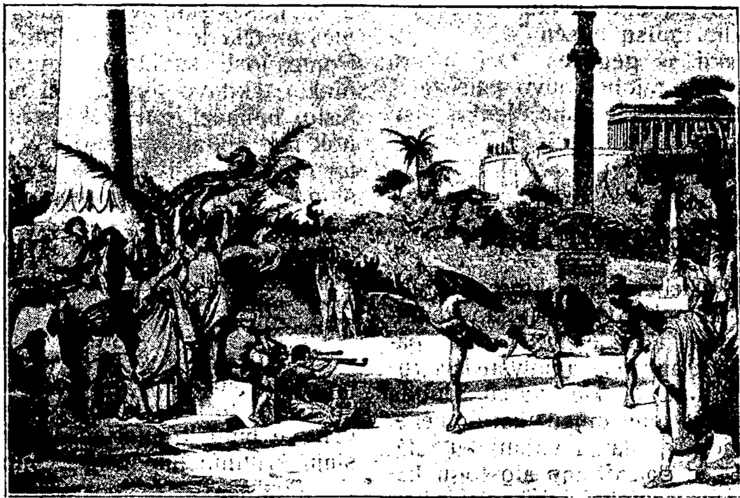
Senovės graikų sporto Stadionas ir Olimpijos žaislai. Senovės graikai atsižymėjo dideliu sporto, įvairių mankštinių bei žaislų gryname ore pamėgimu. Kas keturi metai prie Olimpo miesto buvo daromos didelės rungtynės, kurios vadinosi Olimpijos žaislais, o keturi metai tarp vieno ir kitu didžiųjų žaislų vadinosi Olimpiadomis. Tychia buvo padaryta graži žymi žaislams vieta, vadinama stadionu. Nugalėtojai gaudavo dovanų ir jie buvo garbinami visoje graikų žemėje. Dėliai savo aukšto sportinio kūno (ir dvasios) išlaivimo graikai priešams buvo beveik nenugalimi.

Skerspiūvė, skerspiūklis—пила поперечная.