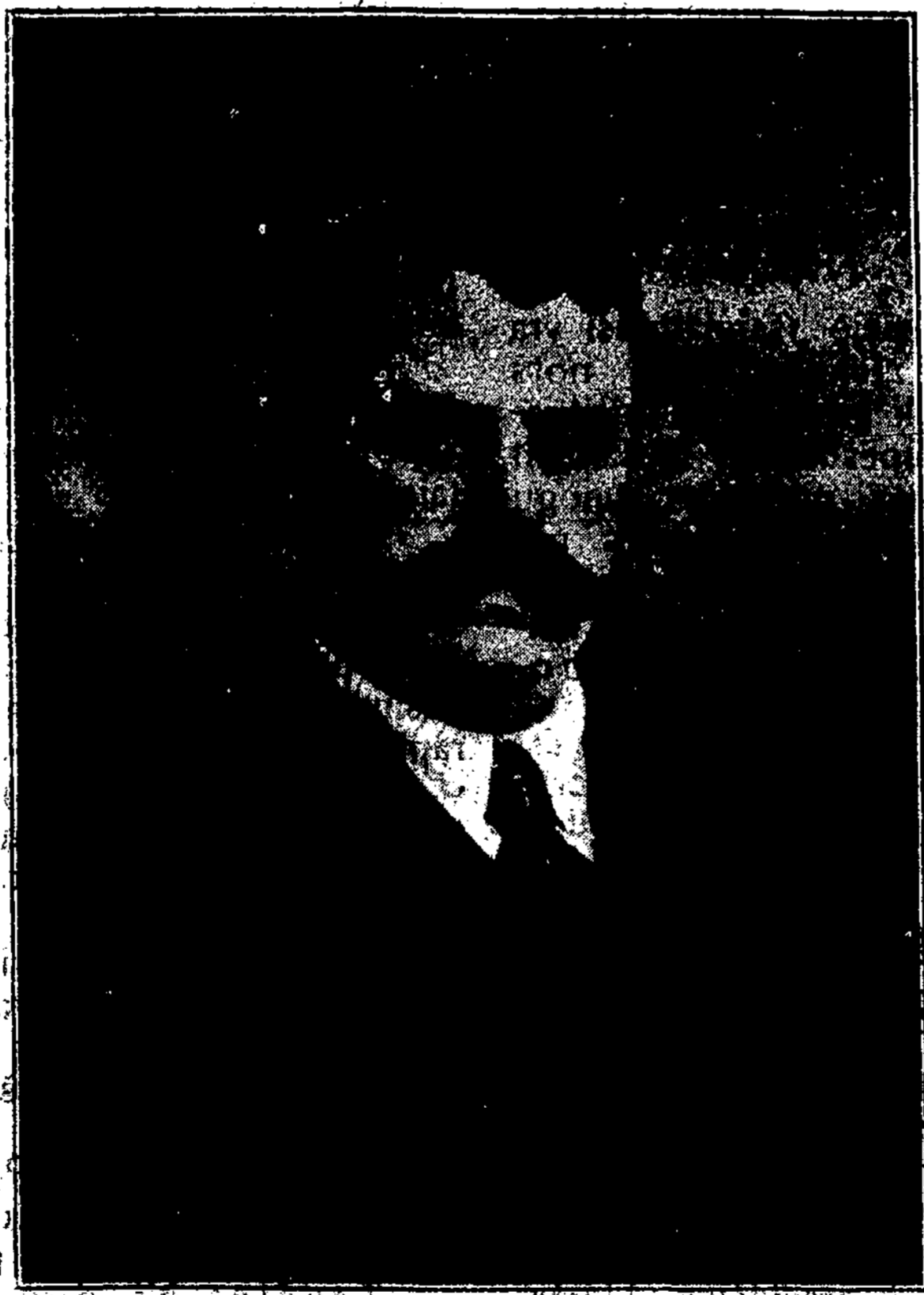
Cekoslovakų Krašto Apsaugos Ministeris

Kariuomenei tenka atlikti sunkią užduotį: ginti Valstybę nuo priešų, bet ir sėkmingiausiai atlikti šią šventą pareigą kariai neprivalo manyti, kad vardan užtarnautų nuopelnų (bei būsimųjų vargų) jie gali ramiai laike atsivaduoti nuo kareivių piliečio pareigų. Neuzienka apginti Valstybę, bet dar reikia