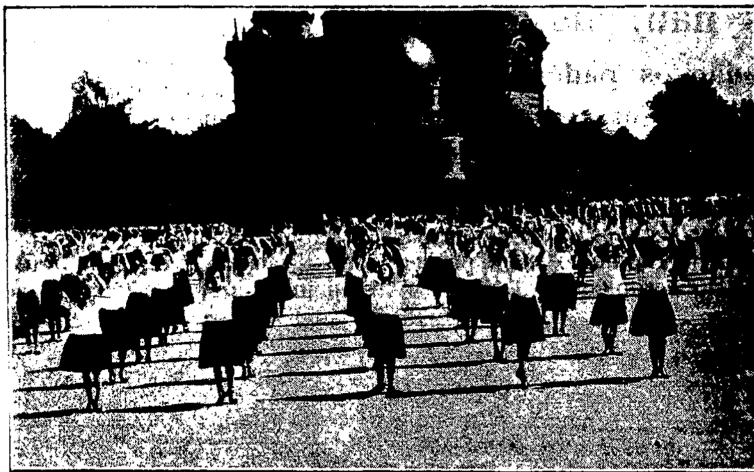
Propogandinė Rygos mokyklų sporto šventė Rygoje. Tokios šventės esti kasmet gegužės — birželio mėn. Jose dalyvauja visų mokyklų moksleiviai — ir daro masinius gimnastikos užsiėmimus, dalyvaujant iki 5000 moksl. Čia atvaizdinta dalelė (moterų gimnazijos grupė). Vyksta tai ant Eksplondos aikštės.

— Karo nuostolių atlyginimas. Komisija, kuriai yra pavesta nustatyti iš Vokietijos reikalaujamą karo nuostolių atlyginimo sumą, nusprendusi reikalauti iš Vokietijos 1.479.064.313 dol., t. y. apie 6 milijar-