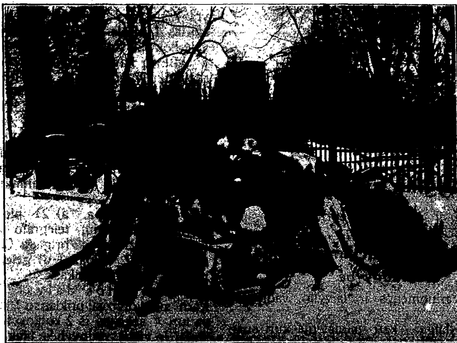
Sukilėlių brolių kapas Klaipėdos kapuose. Garbingai žuvo, garbingai pagerbti: kapas vainikais nuklotas.

Visi „Blaivybės“ skyriai ir tam darbui pasižventę žmonės kviečiami sekmadienį, birželio 24 d. birželio 29 d. ir liepos 1 d., kaip galint geriau ir išskilmingiau prarasti. Renkime tam dikrus priešalkoholinius mitingus laukime įvairių draugijų susirinkimus, dary-