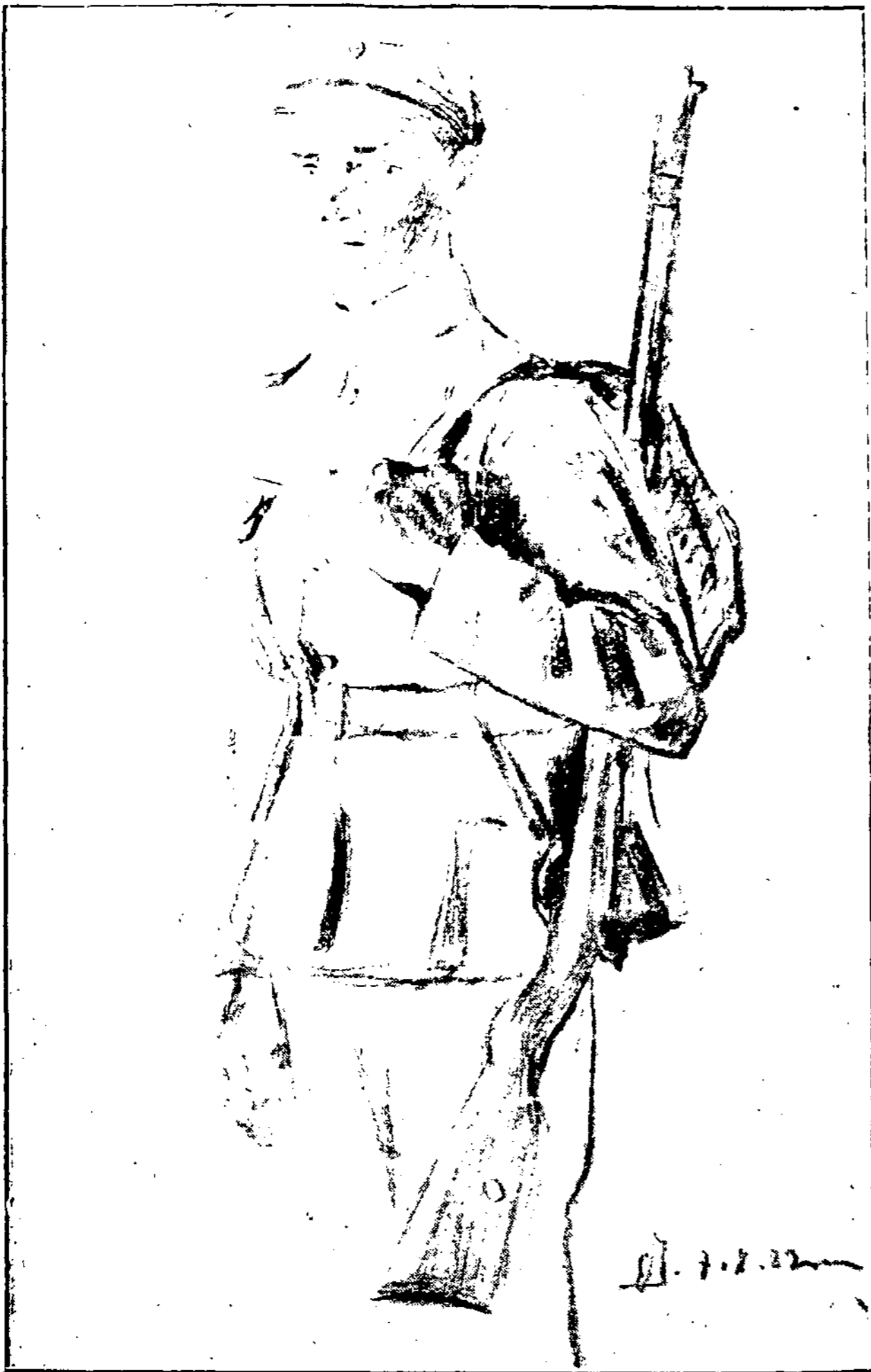
Pėstininkas senoj formoj.

Žydai sukilo. Žydų emigrantai Palestinoje neradę darbo, sukilo. Numalšinimui žydų pasiūsta