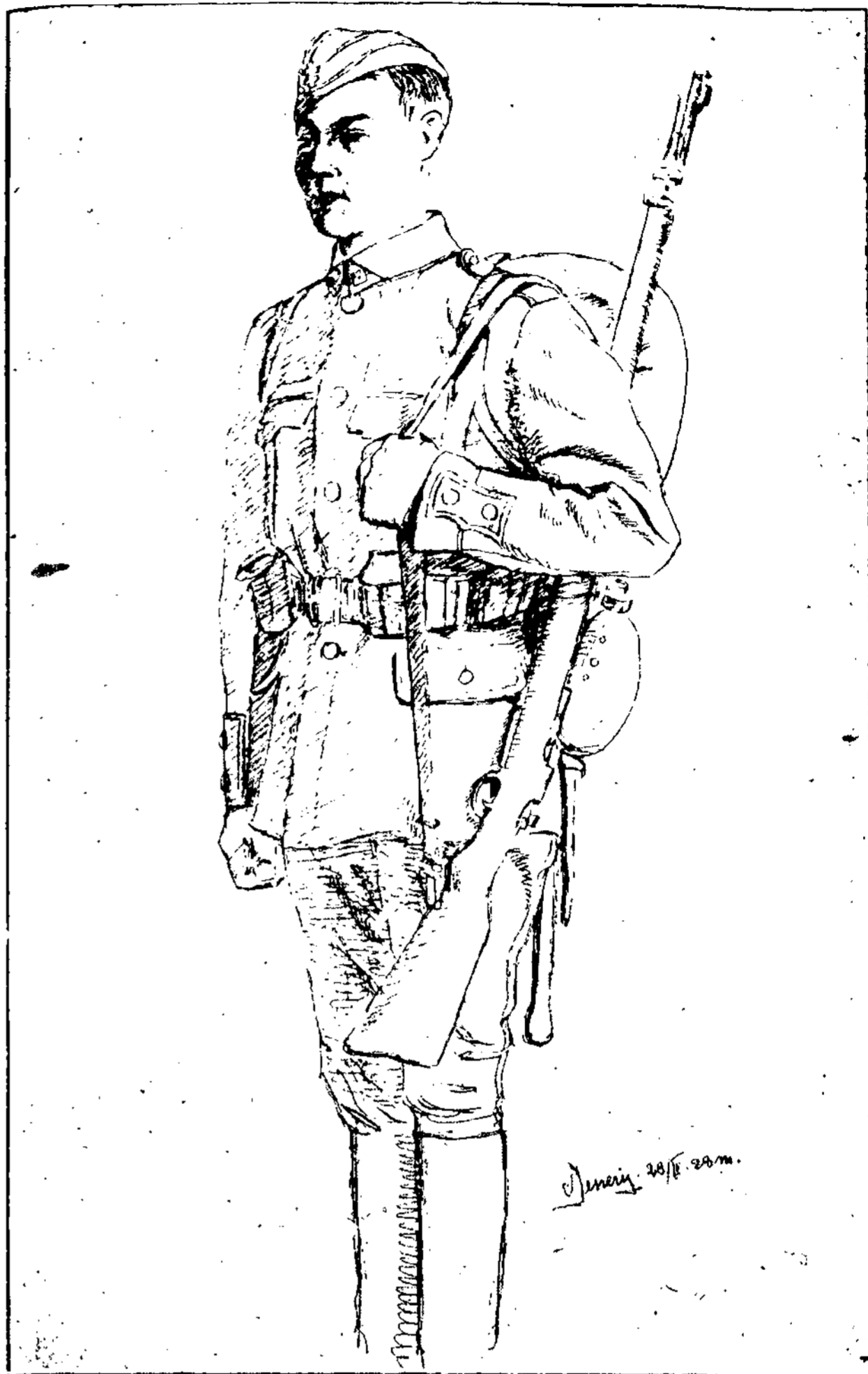
Pėstininkas naujoj formoj.

reikia turėti ypatingai tinkamų vadų, tinkamai paruoštų savo aukštam tikslui pasiekti.