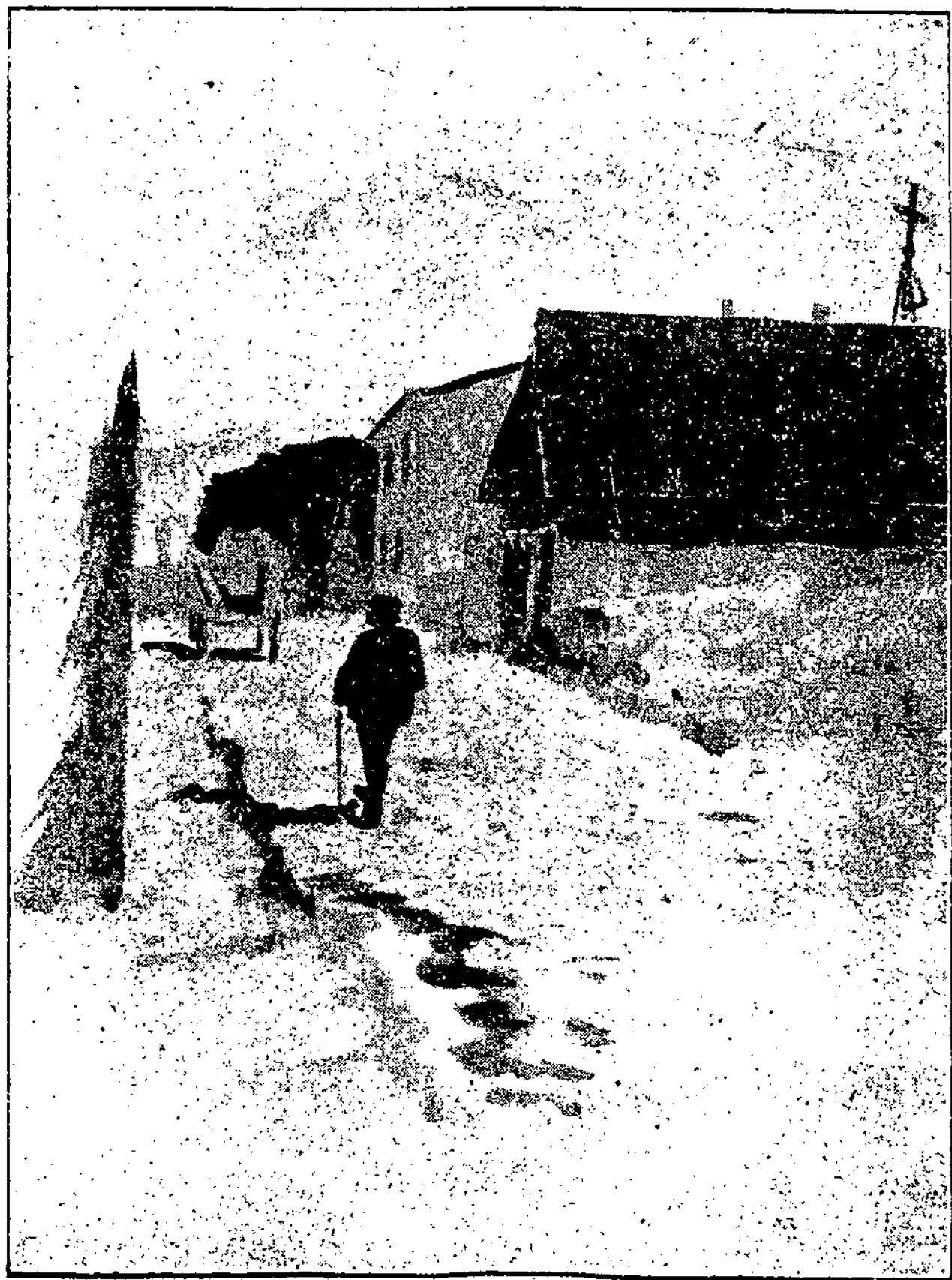
Klaipėda: žvėjų kampelis.

nodas – tokiam atsitikime, be abejonės, negali būti vienodos spalvos rankogaliai ir apikaklės; rankogalių ilgis nevienodas, rankogalių priedeliai – taip pat (jau galima matyti rankogalių priedelių, kurių viršutinis