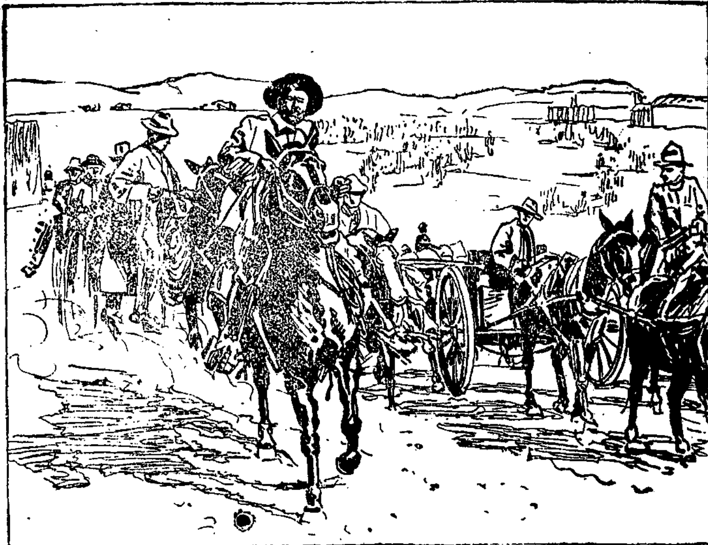
Sukilimas Meksikoj: sukilėlių kariuomenės rinktinė.

— Japonijoje. Laikraščiai praneša, būk Japonijoje įvykę riausių. Minia norėjo įsiveržti į ministerio pir-