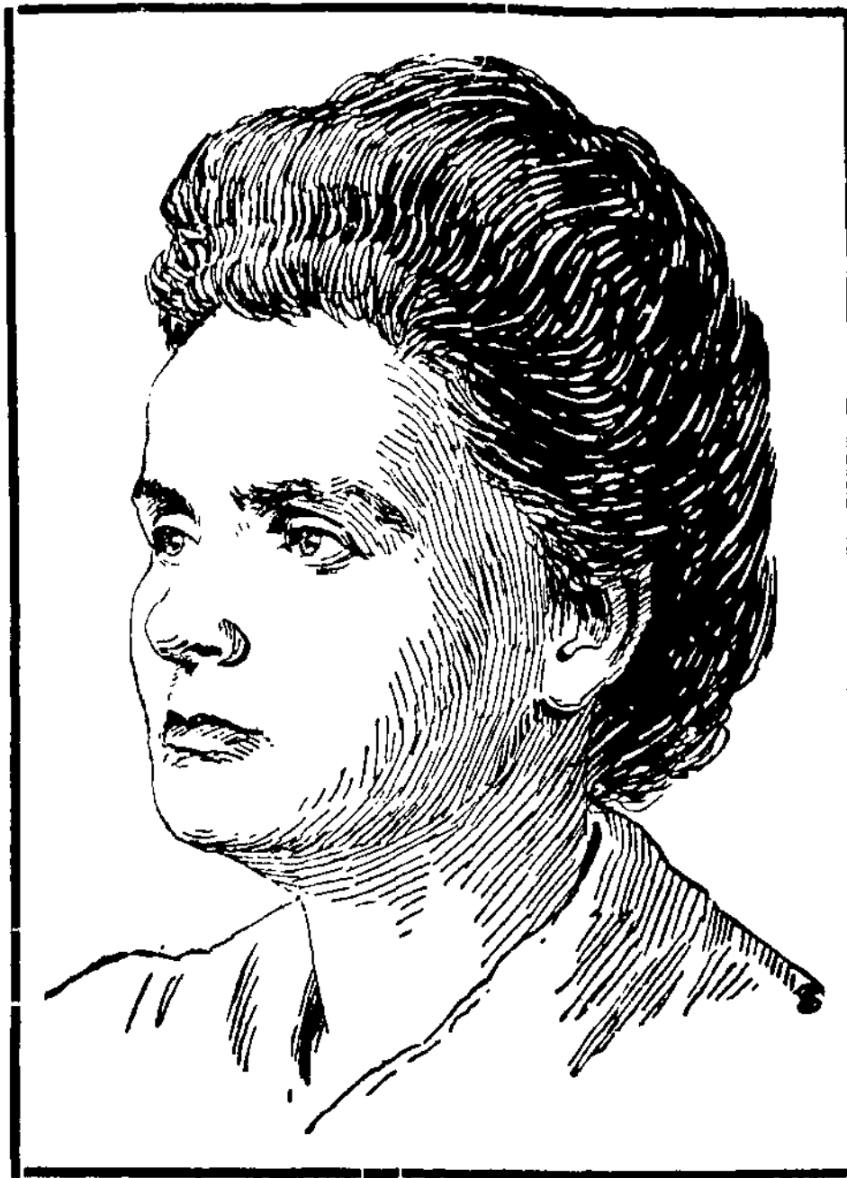
Ponia profesorė Kiuri (Curie), gim. Sładowskaitė, Varšuvoje 1867-XI-7 d. Drauge su savo vyru prof. Curie Prancūzijoje dirbo radioaktingų elementų — radiaus ir poloniaus — ištyrimui. Už chemijos darbus 1903 m. ponas ir ponia Curie gavo Nobeliaus premiją, 1911 m., vyru mirus, ponia C. gavo Nobeliaus premiją antrą kartą. Nuo 1919 m. ponia C. užima radiologijos profesoriaus vietą Varšuvos universitete. 1928 metais, 25 metų radiaus radimo sukaktuvėms, ponia Curie gavo iš Prancūzijos 40.000 frankų dovanos.

„Aleksandras Makiedonietis“ iš tolimos Persijos savo tėviškėn, Graikijon, siųsdavo pranešimus apie savo kariuomenės laimėjimus, uždegdamas kalnų viršūnėse eilę laužų, kurių dūmai toli buvo matyti. Šiuo būdu pasinaudojo šveicariečiai, sukilimo prieš žiaurus Austrijos valdininkus visiems vienu laiku paskelbti. Dabar givartojamas tele-