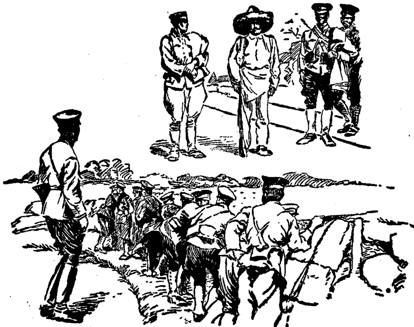
Sukilimas Meksikoj. Viršujų žvaldžios kariuomenės kareiviai; apačioj: kovoj su sukilėliais.

Smulkiau tą pirmąjį mūsų kariuomenės mūšį galėtų