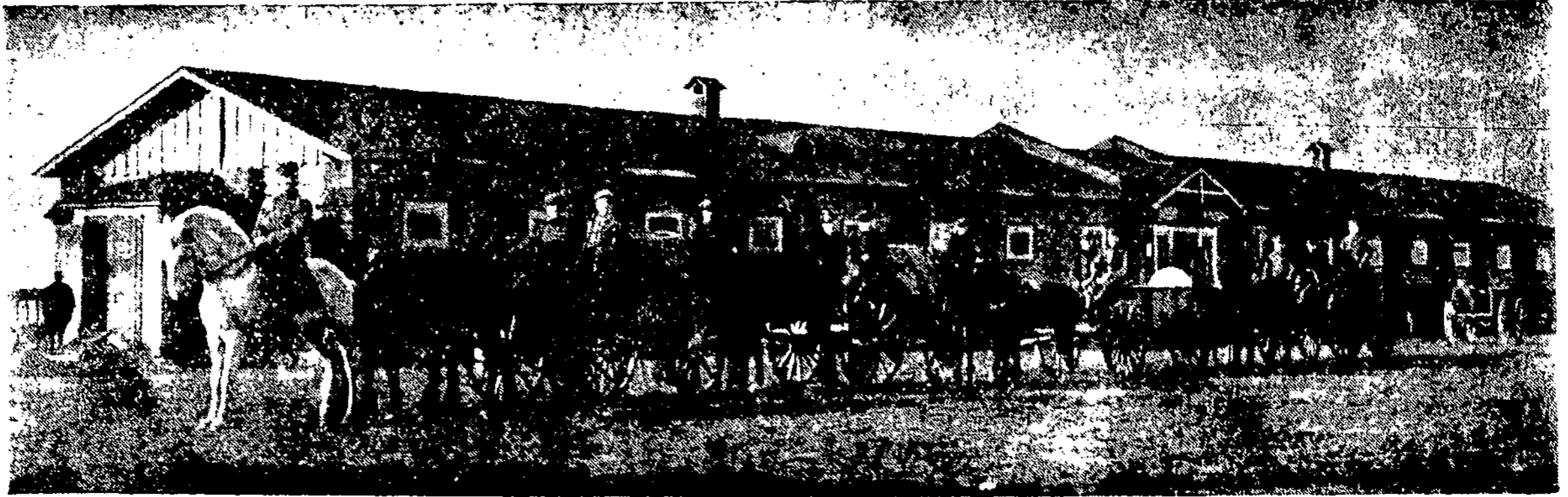
Iš pirmųjų dėl Nepriklausomybės kovų.

Naujai susidarė draugija „Ormgurd“, kuri jungia visus puskarininkus, likusius ištikimais senai tvarkai ir studentų, — monarchistų draugiją.