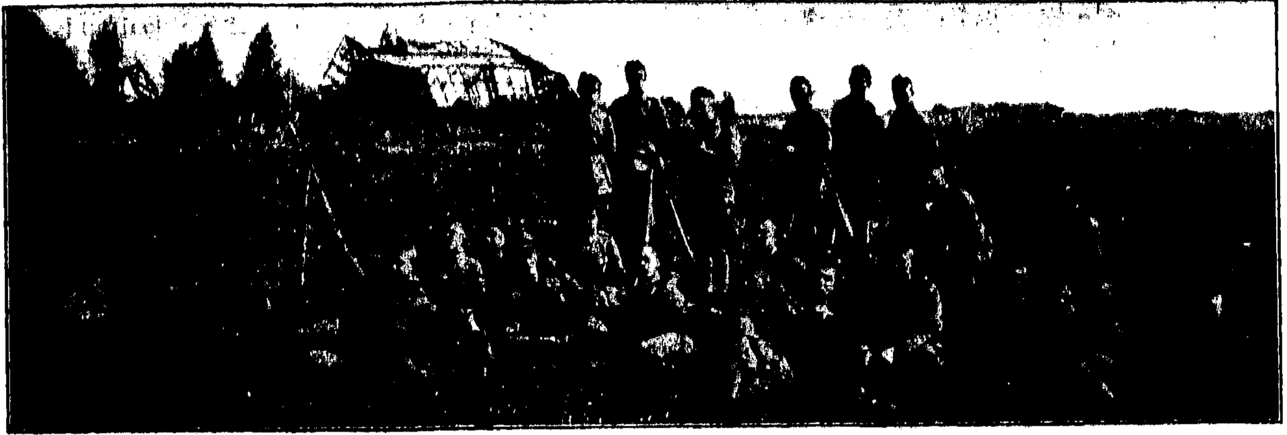
Oro laivyno komandos poilsis po rikiuotės užsiėmimų. (1919 metai)

gia, alkis kankina, nuovargis marina... neįspėsi... neįspėsi, nes kareivis dainuodamas visus savo vargus užmiršta, stiprina sielos jėgas, dainuodamas malšina liudėsį ir sukelia drąsą į kovos lauką žengiant. Neįspėsi... Neįspėsi..